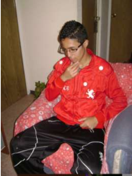
Brandon, junio 2013