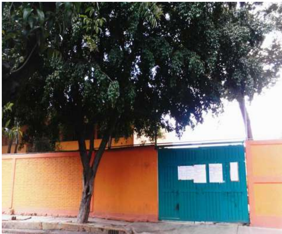
Entrada de la Secundaria 89, mejor conocida como el "Reclusorio" 89, 2013.

La violencia es un comportamiento deliberado. Se utiliza para ejercer el poder sobre otra persona con el objetivo de someterla y lograr un beneficio propio. El comportamiento violento tiene muchas variantes, y éstas se dan en forma individual o combinada. La intimidación no es sólo el daño físico provocado a otra persona sino también puede ser un daño psicológico o emocional. La agresión física son todas las formas de agresión que dañan el cuerpo de la víctima y pueden dejarle marcas o huellas externas: golpes, mordiscos, empujones, cachetadas, pisotones, patadas, jalones de cabello o de orejas, rasguños, correazos, quemadas, pellizcos, etcétera. Pueden ser causadas con cualquier parte del agresor o algún objeto.