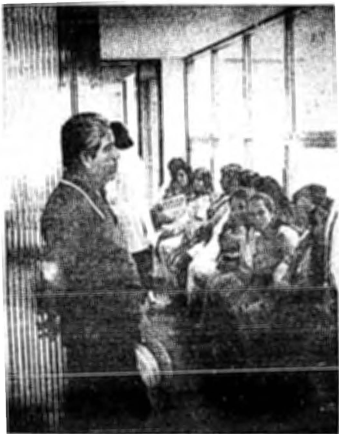
SOLICITANTES EN LA BOLSA DE TRABAJO DE LA DIRECCION DE TRABAJO SOCIAL DE LA SECRETARIA DE SALUBRIDAD Y ASISTENCIA