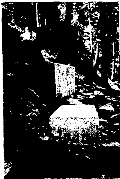
Toma de Agua

Las fuentes de aprovisionamiento del agua se encuentran al Este de la carretera de Toluca, a la altura del kilómetro 31, lugar que lleva el nombre de "Agua Bendita". Dichas fuentes están constituidas por dos manantiales cuyas aguas se captan en dos recipientes de mampostería, que van a terminar después de un trayecto diferente para cada uno de ellos, a un recipiente colector, de donde es llevada hasta el pueblo.