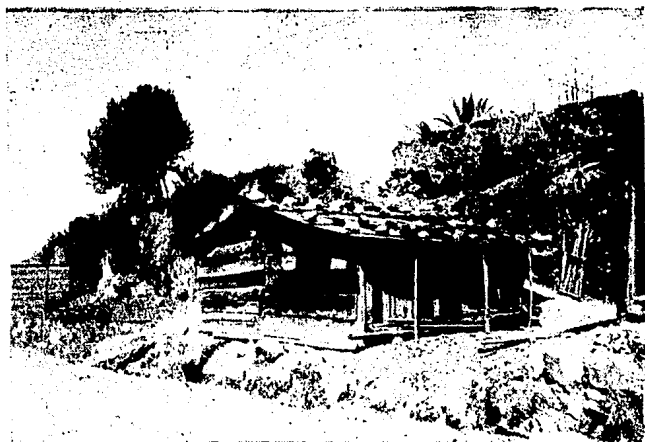
Tipo de casa del pueblo

Para darnos cuenta de la manera como viven las personas en este pueblo, describiré dos tipos de casa, correspondiendo la primera a las personas acomodadas y la segunda a los pobres.