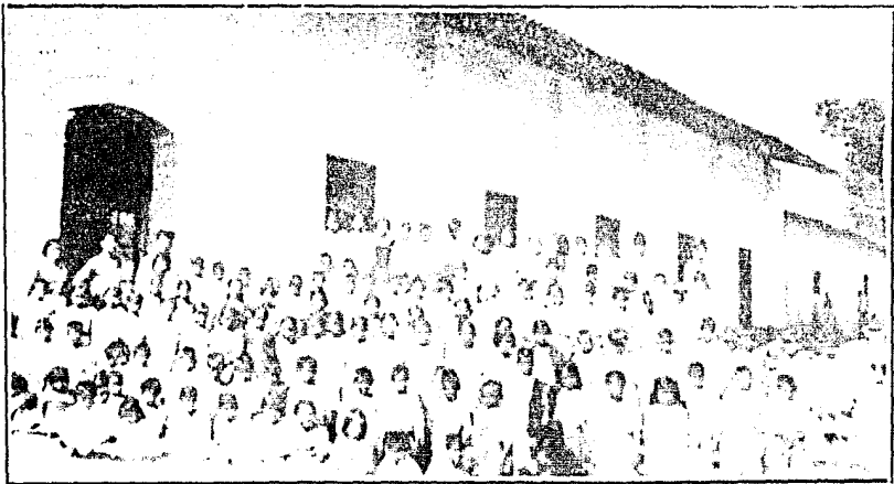
Vista del Edificio que ocupa la Escuela "Cristóbal Hidalgo". Profesores y Escolares que lo forman

Existen 10 escuelas más, en todo el Municipio en los siguientes pueblos: Ixtapan, Ocotepec, Pantoja, Rincón del Carmen, Rincón de Ugarte, Teneria, Amoloya de las Granadas, La Laguna, Acatitlán y San Lucas del Maíz; excepto ésta última que pertenece al Estado, las demás son dependientes de la Federación.