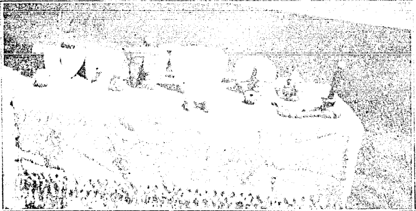
Pequeña colección arqueológica de la época Pre-cortesiana, en el Mpio. de Tejupilco

más en 1530 cuando pasó a la conquista de Jalisco. Las innumerables pirámides de tierra y piedra laja sin labrar que se encuentran formando calles en la sierra de Nauchititla y diseminadas por Ixtapan, así como los jeroglíficos que se encuentran en los grandes cantos rodados de las márgenes del río de Pungarabato, son testimonios étnicos que dejó a su paso aquella raza del Sur, la que tal vez se extendió hasta el Norte de la Costa del Pacífico. Según otras opiniones se asienta que también fué habitada por tribus Matlatzinecas emigradas del Valle de Toluca, habiéndose encontrado en un grado avanzado de civilización como lo demuestra la pequeña colección arqueológica propiedad del señor González.