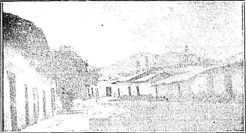
Vista panorámica de la Villa de Tejupilco

El Estado de México se encuentra situado la mayor parte en la mesa Central del Anáhuac, teniendo como límites: al Norte, los Estados de Querétaro y de Hidalgo; al Este, los Estados de Tlaxcala y Puebla; al Sur, los Estados de Morelos y Guerrero; y al Oeste, el Estado de Michoacán; quedando comprendido en su centro el