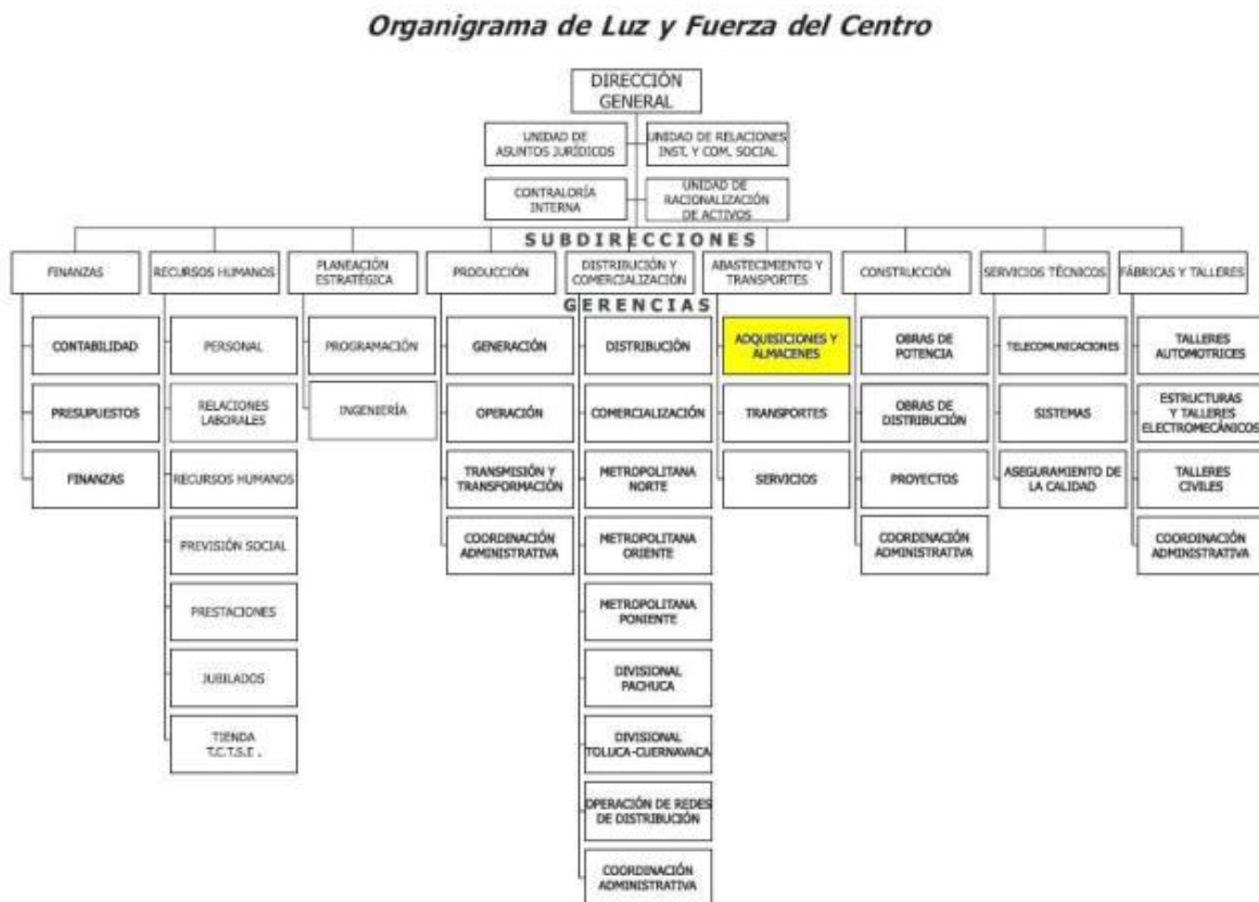
Organigrama de la extinta paraestatal Luz y Fuerza del Centro

Nota. Adaptado de “Centros de trabajo en luz y fuerza. Orígenes y desarrollo” [Figura], por Coello, J., 2013, http://kilowatito2009.blogspot.com/2013/08/los-almacenes-de-luz-y-fuerza-del.html