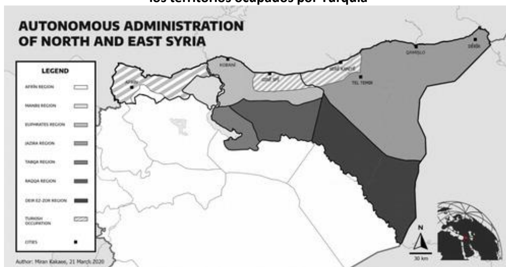
Mapa 4. Las siete regiones de la Federación del Norte y Este de Siria y los territorios ocupados por Turquía

Cuando haces una revolución contra el patriarcado, contra el capitalismo, contra el Estado nacional, no puedes contar con el apoyo de otros Estados. Por eso sabíamos desde el principio que la revolución de Rojava era un paso arriesgado, pero una revolución nunca es un camino fácil. Rojava se ha preparado lo mejor que ha podido para afrontar estos días. Las fuerzas de autodefensa están preparadas e intentaremos defender este proyecto a toda costa (en Garrido, 2019).