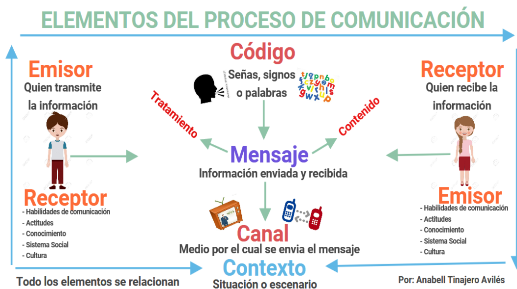
Figura 1. Elementos del proceso de comunicación

Por otro lado, se ha hablado acerca de dos tipos de comunicación, la verbal y la no verbal. Dentro de la a comunicación no verbal, según lo planteado por Cubero, Abarca y Nieto (1996), refieren a esta comunicación, a las interacciones, ya sea entre el maestro o padre con el estudiante, por medio del lenguaje corporal, el cual es entendido como el mensaje emitido con diferentes partes del cuerpo o gestos, y pueden ir acompañados, no siempre, de breves expresiones verbales; caso contrario a la comunicación verbal, en la que todo se expresa a través de palabras, para poder transmitir un mensaje.