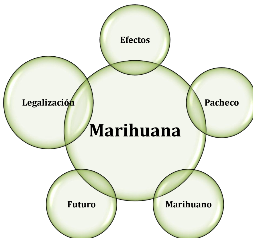
Figura 3. Categoría: Marihuana y sus códigos: Modelo figurativo con núcleo central y periferia

En esta categoría se da un panorama general de lo que para nuestros participantes es el imaginario social que ronda al concepto “marihuana”. Tomando como punto de partida los efectos que causa y la forma cómo la sociedad ve a los consumidores. Para los participantes de nuestro estudio, el sector de la población que reprueba esta conducta son los señores (adultos de la edad de sus padres), pues el imaginario social que este grupo comparte es que los