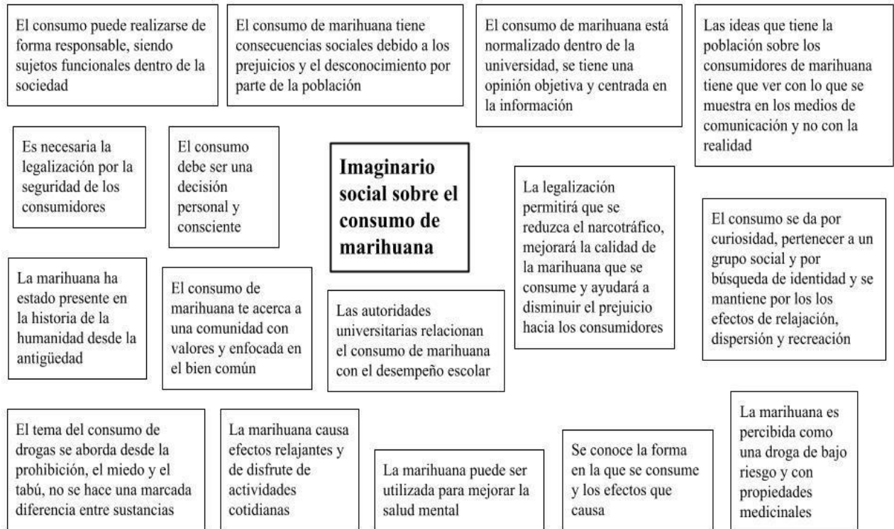
Figura 5. Imaginario social de los universitarios sobre el consumo de marihuana: Modelo figurativo con núcleo central y periferia.