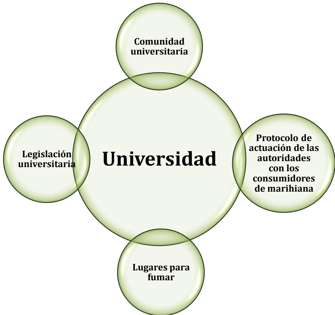
Figura 4. Categoría: Universidad y sus códigos: Modelo figurativo con núcleo central y periferia

Los elementos que conforman esta categoría son los relacionados con las experiencias, las normas que la universidad establece con relación al consumo de drogas dentro de sus instalaciones, las posturas que toman las autoridades frente a los consumidores, los lugares donde se reúnen los universitarios para consumir marihuana y cómo es la percepción que ellos observan dentro de esta sociedad con relación al consumo de marihuana.