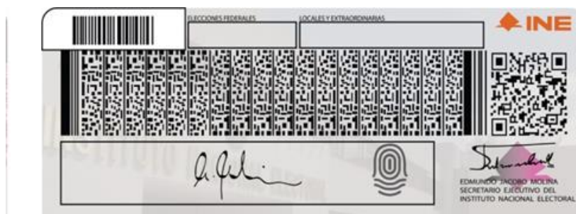
Imagen 4, Periódico Enfoque, INE refuerza protocolos para evitar uso indebido de credencial de elector, https://www.periodicoenfoque.com.mx/nacional/ine-refuerza-protocolos-para-evitar-uso-indebido-de-credencial-de-elector , Consultado el 26 de noviembre de 2020.