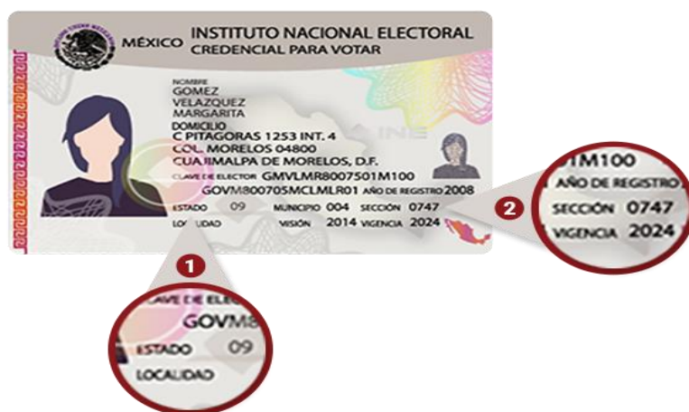
Imagen 3. Buró parlamentario, Sección electoral, https://buroparlamentario.org/home , consultado el 26 de noviembre del 2020.

La página web de Buró parlamentario es bastante fructífera sobre el objetivo para el que fue creado. Pero pese a ser una gran herramienta de información cuenta con problemáticas que entorpece su función. Como lo es la difusión entre los ciudadanos, ya que los medios de comunicación, no ha sido tema de información sobre los beneficios y la utilidad de esta herramienta en segundo lugar, solo muestra la información de cada legislador.