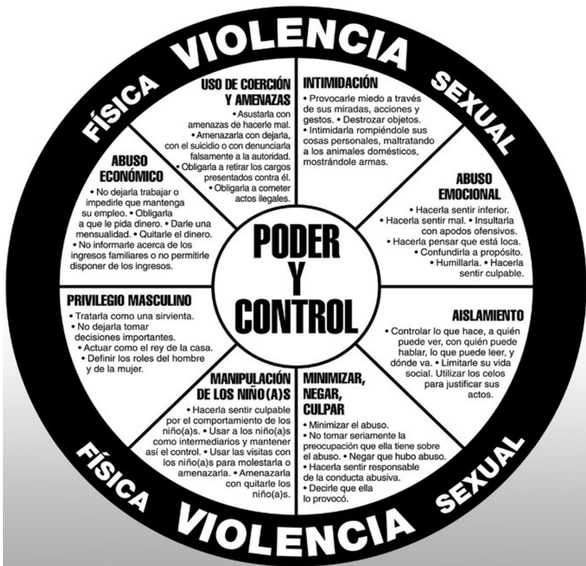
Rueda de poder y Control