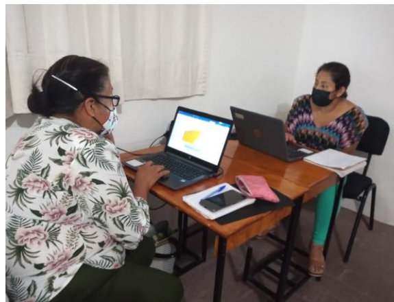
Figura 9.- habilidades digitales