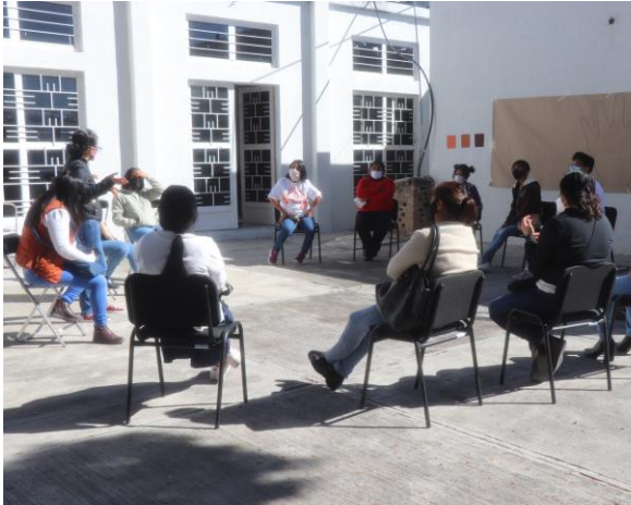
Figura 1.- Dinamcia de presentacion