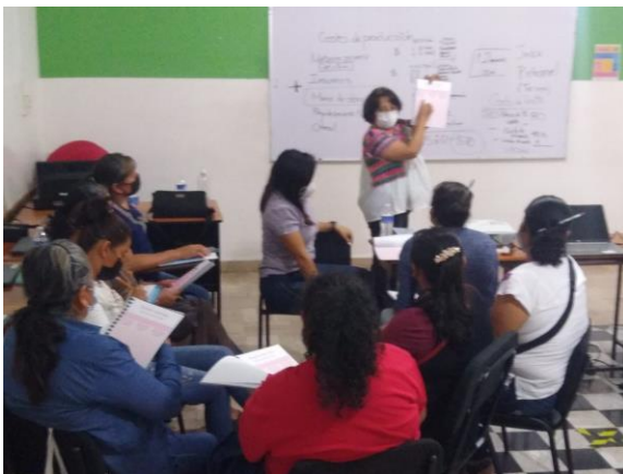
Figura 3.-plenaria de las palabras significativas