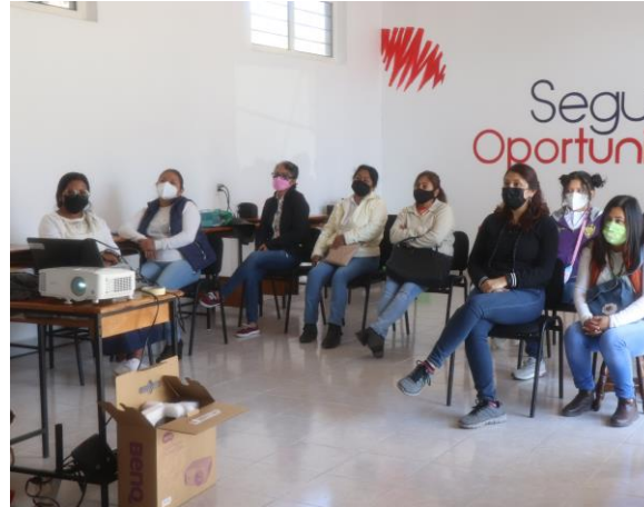
Figura 2.- proyeccion del cortometraje