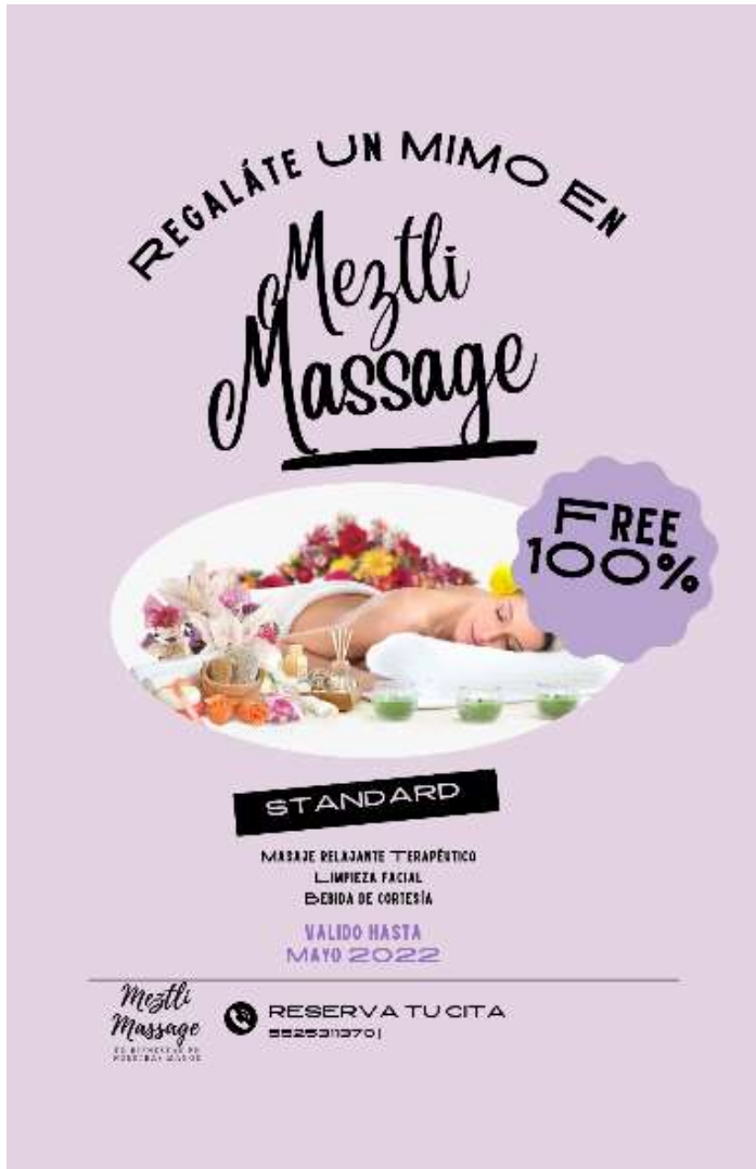
Anexo 3 Cupón