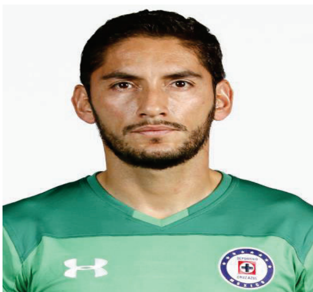
José de Jesús Corona Rodríguez. Futbolista profesional. Club Deportivo Cruz Azul.

Aquel domingo tenía pactada una entrevista a las tres de la tarde. Ese día se acumuló la gente y la tienda obligaba a comprar para acceder al lugar donde la gente se amontonaba para obtener la firma del Christian "Chaco" Giménez. Hacía días que había anunciado su retiro sin haber sido campeón con Cruz Azul.