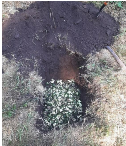
Figura 4. Fosa con frutos afectados por Helipus lauri en Ixtapan del Oro, Edo Mex.

Toda la fruta que se encontró dañada se colectó y depositó en una fosa cavada dentro de la huerta de 1.0 m x 1.0 m a una profundidad de 1.0 m, la fruta se seccionó con machete (figura 4). Es viable una aplicación superficial de insecticida y hongos entomopatógenos sobre la fruta disectada, como malatión para el control químico y los hongos entomopatógenos Beauveria bassiana y Metharhizium anisopliae . para el control biológico, posteriormente se enterraron los frutos siguiendo la metodología descrita en el manual operativo.