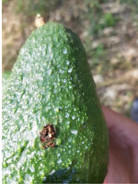
Figura 3. Oviposición de Helipus lauri en huerto comercial en Ixtapan del Oro, Edo Mex.

Con base en la experiencia del equipo de control de focos de infestación en la zona, realizar una aplicación inicial de malatión y hongos entomopatógenos antes de retirar la fruta infestada genera mejores resultados, pues de esta forma al estar el adulto expuesto se tiene mayor eficiencia de control. Para ello en el muestreo de identificación y alcance de daños fue necesario no hacer mucho movimiento de la fruta y el árbol, pues es común que esta plaga al sentir movimientos anormales en su entorno se deje caer al suelo como mecanismo de adaptación, lo anterior con el objetivo de que la aplicación de insecticidas surta un mayor efecto y el adulto se encuentre en el árbol al momento de la aplicación. En la siguiente visita a los 15 días de haber aplicado el primer control químico y biológico, se muestreó nuevamente el huerto para validar si las afectaciones por barrenador continuaron, posterior se retiró la fruta dañada y nuevamente se realizó aplicación de producto químico y biológico. Para continuar con los monitoreos posteriores conforme lo indica el manual.