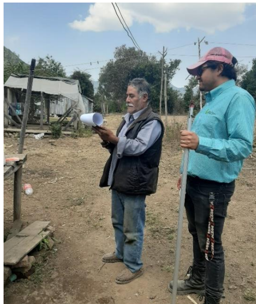
Figura 2. Plática a productor en comunidad el Capulín.

Los temas que se presentaron durante el desempeño profesional fueron de índole: técnico-operativos de la campaña, identificación, biología, hábitos de la plaga, daños ocasionados, acciones de control cultural, químico y biológico, entre otros aspectos, que en el caso particular del municipio de Donato Guerra se considera también los conflictos con la delimitación de las áreas naturales protegidas para la expedición de avisos de inicio de funcionamiento.