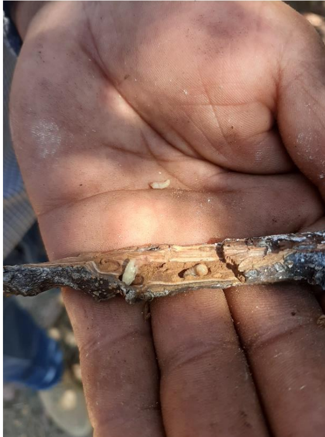
Figura 1. Diferentes estadios de Coptorus aguacatae en un segmento de 10 cm de rama de aguacate.

La figura anterior fue tomada en un recorrido de muestreo en la comunidad de San Juan Xoconusco. Todas las actividades y resultados de muestreo se vacían en sistema informático que determinó la DGSV.