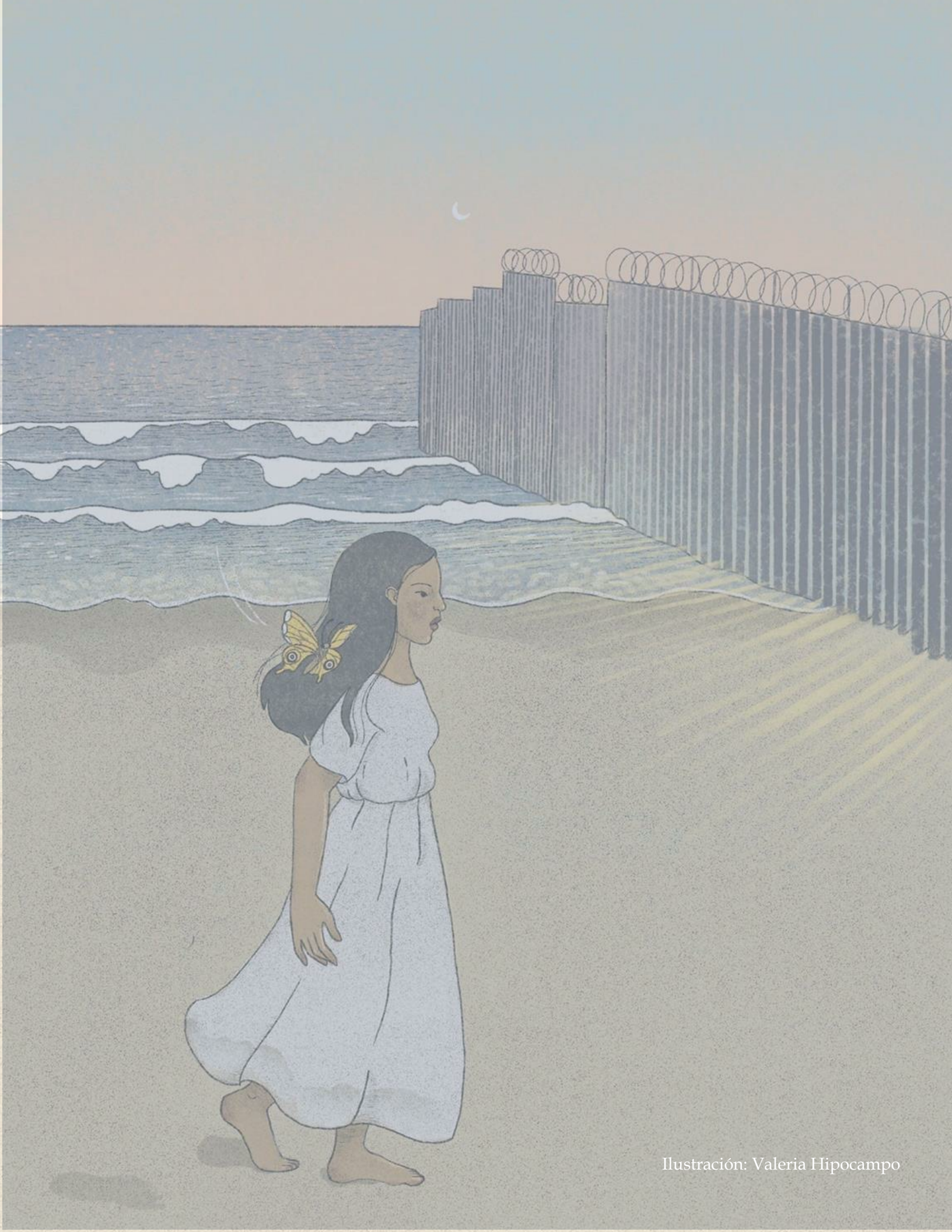
Ilustración: Valeria Hipocampo