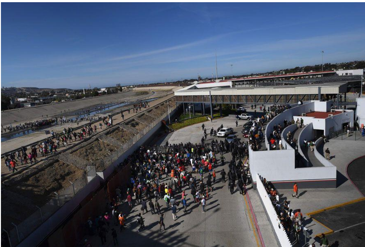
Espacio de filtración migratoria México – EE.UU. 462

La concesión de internamiento a ciertas personas no se desarrolla en oposición a la obstaculización y generación de sufrimiento y muerte de otras, sino en paralelo. Las fronteras no solo representan una de las condiciones para salvaguardar la realidad del Norte global, sino que también hacen posible la producción de sujetxs muertxs en vida y lucrativxs. Como menciona Amarela Varela Huerta, las fronteras [también] se gobiernan con políticas que infligen terror en los cuerpos, historias y comunidades de quienes las desafían al intentar atravesarlas “sin los papeles en regla”. 463