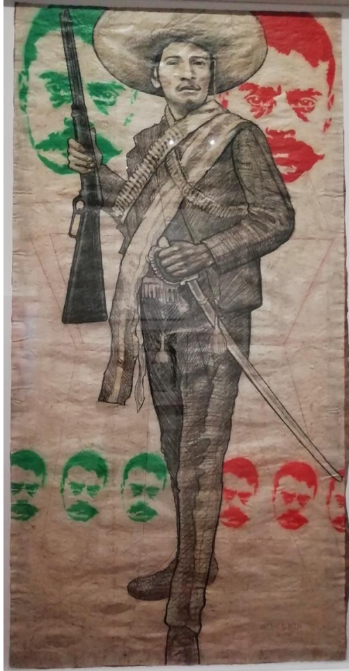
Foto tomada en la muestra "Zapata después de Zapata" en marzo de 2019. Obra realizada por Arnold Belkin entre 1985-86 "Lucio Cabañas como Zapata".