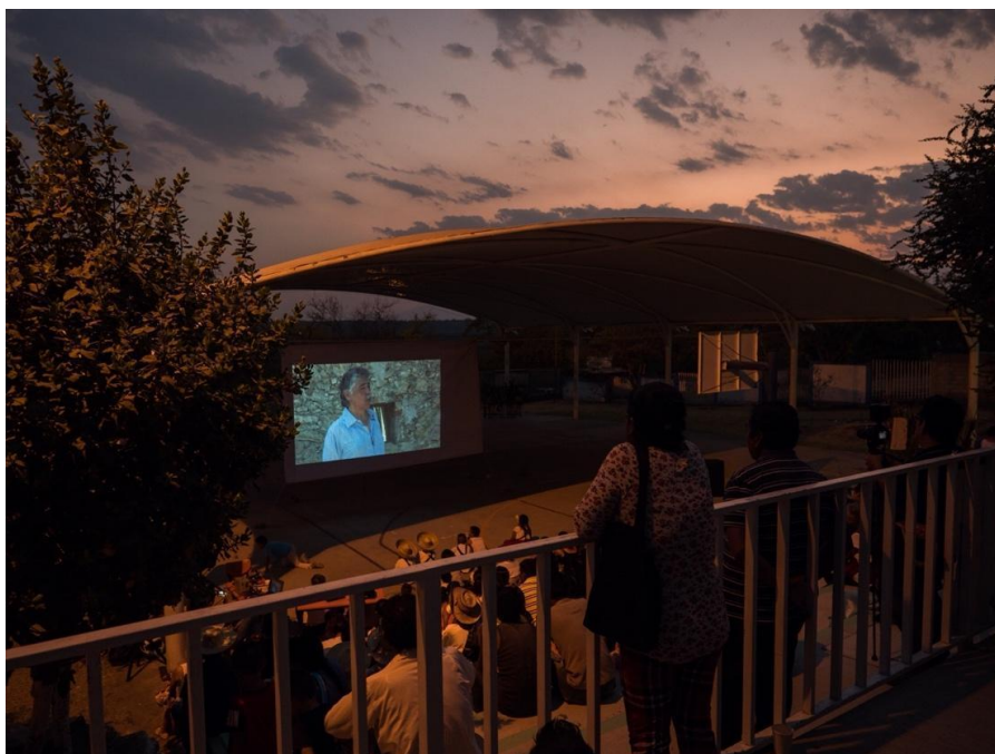
Proyección del documento “Hasta que tengamos patria” en una escuela del pueblo de Alpuyecá, Morelos. 9 de abril de 2019.