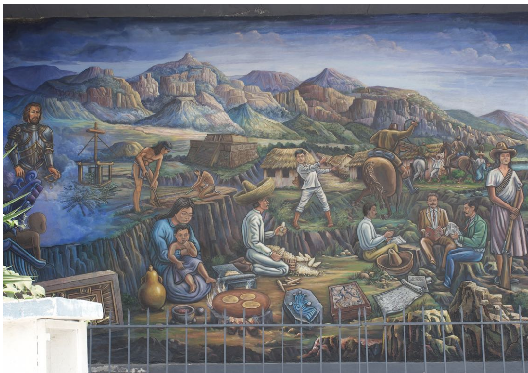
Fragmento del Mural Principal del Museo Casa Zapata.