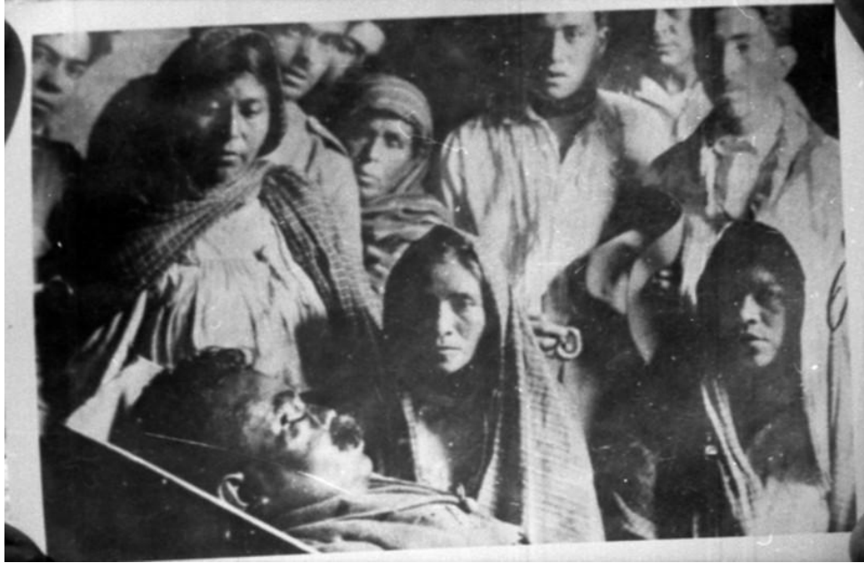
“Gente observando el cadáver de Zapata”