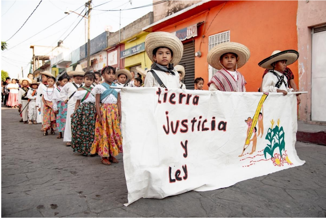
Desfile y marcha popular de escuelas primarias por el Centenario Luctuoso de Emiliano Zapata. Alpuyeca, Morelos. 10 de abril de 2019.