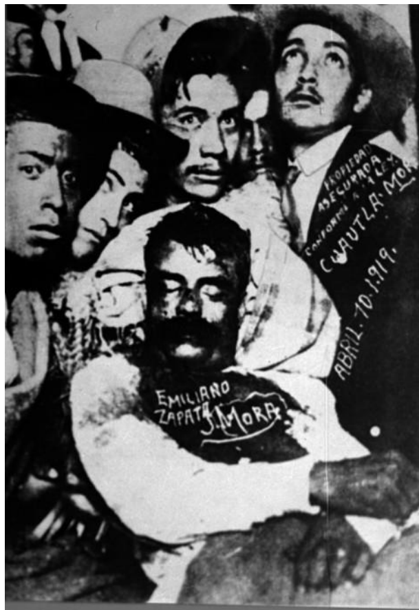
“Cadáver de Emiliano Zapata exhibido en Cuautla” 10-04-1919.