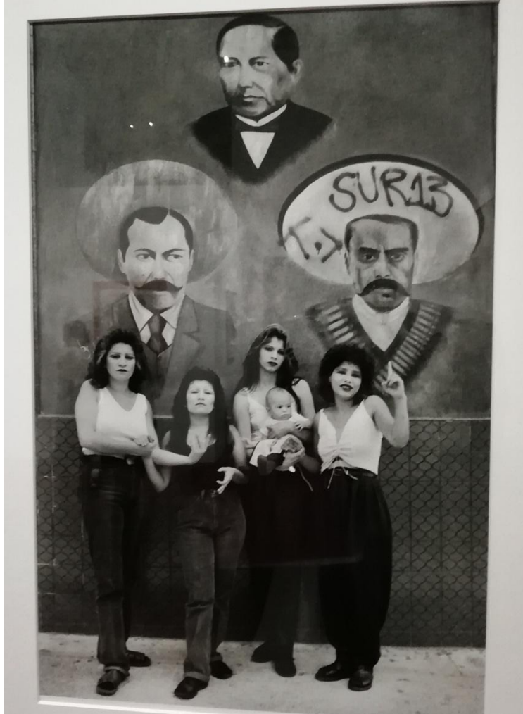
Foto tomada en la Muestra "Zapata después de Zapata" en marzo de 2019. Obra realizada por Graciela Iturbide bajo el nombre Cholas con héroes Juárez, Villa y Zapata , 1986.