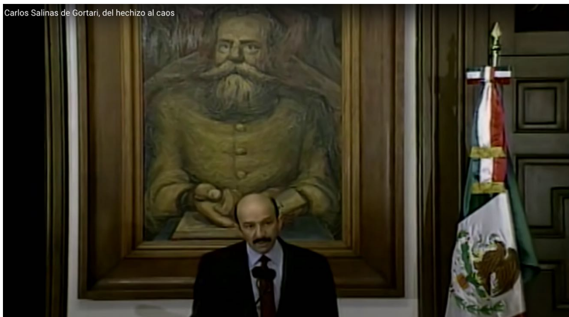
Imagen tomada del material audiovisual que documenta el discurso pronunciado por Salinas de Gortari el 10 de enero de 1994.

chiapanecas y comunidades (tampoco aclara cuáles) no están de acuerdo con el alzamiento y “se han acercado para reclamar protección por parte del Ejército mexicano”. Y por último sentencia: “pueden seguir provocando acciones aisladas de violencia, pero van a fracasar”. Sin embargo, unos días después -el 10 de enero-, el presidente debió “bajar el tono” en relación al levantamiento que se estaba propagando desde San Cristóbal de las Casas hacia todo el país y que estaba teniendo resonancia a nivel nacional e internacional. En esa oportunidad decidió dar el mensaje con la imagen de Venustiano Carranza de fondo para anunciar la decisión de suspender “toda iniciativa de fuego en el estado de Chiapas”. Carranza como una amenaza, Zapata como la salvaguarda del pecado original. Unos días después (16 de enero) Salinas anunciará la amnistía general (“a todos los participantes en los hechos de violencia que afectaron varios municipios del estado de Chiapas”) que el 20 de enero enviaría el Congreso para hacerla ley y se aprobaría el día 21 en Diputados y Senadores. Según la norma, “se beneficiará a todos aquellos que estén involucrados en delitos que se desprendan del conflicto armado en Chiapas, a condición de que entreguen rehenes, armas, explosivos y demás instrumentos empleados para la comisión de los delitos.”