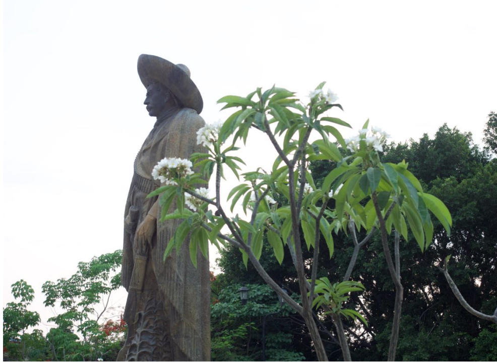
Monumento al “Señor del Pueblo”. Mausoleo de Emiliano Zapata. Cuautla, marzo de 2019.