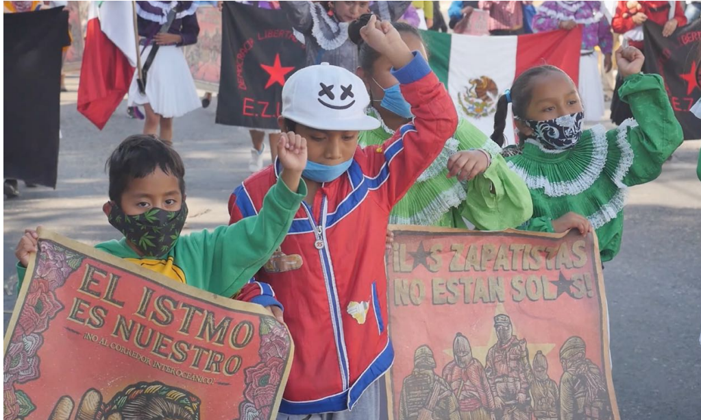
Foto tomada durante la movilización del 28 de noviembre de 2020 en Cuautla en la Conmemoración por el 109 aniversario del Plan de Ayala y contra el Proyecto Integral Morelos.