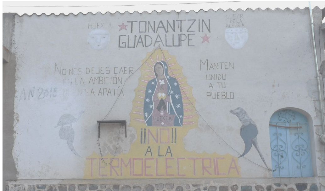
Mural en Huexca, Morelos, cerca de la Termoeléctrica de Ciclo Combinado.

que cada sociedad le otorga. Reflejan contradicciones, disputas, debates y tensiones, que no necesariamente quedan resueltas.