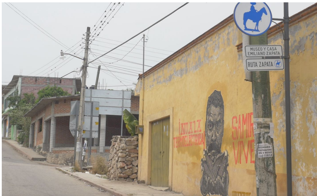
Mural frente al Museo Casa Zapata. Anenecuilco. 2019.