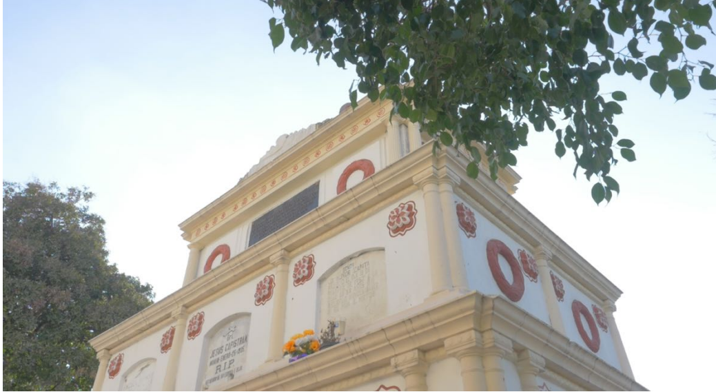
Mausoleo Iglesia de San Miguel, Tlaltizapán.