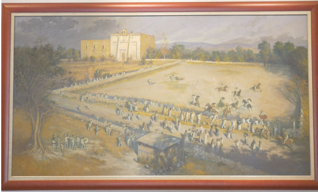
Obra del artista De Antuño (2010) presente en la colección permanente del Museo Casa Zapata.