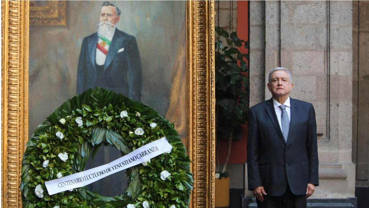
Andrés Manuel López Obrador en los actos conmemorativos del Centenario Luctuoso de Venustiano Carranza. Imagen tomada del documento audiovisual. Mayo de 2021.