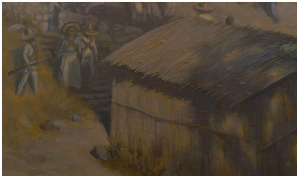
Detalle Obra del artista De Antuño (2010) presente en la colección permanente del Museo Casa Zapata.

Ver más información en la nota al pie 43