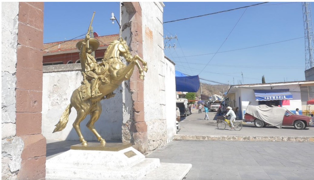
Monumento a Emiliano Zapata en la explanada principal de la Ex Hacienda de Chinameca. Inaugurada durante el gobierno de López Portillo (1976-1982) y bañada en bronce recientemente. Chinameca, marzo de 2019.