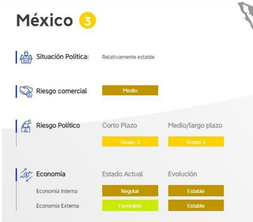
Imagen 4: “México” Extraída del informe CESCE Riesgo País.

Como se puede observar, ambos países (España y México) tienen un riesgo comercial medio, sin embargo México cuenta con un riesgo político mucho más alto que España, otro dato que llama la atención es que actualmente España pasa por un estado desfavorable en cuanto a su