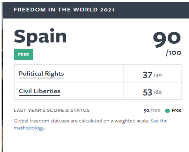
Imagen 1: Extraída del informe Freedom in the world elaborado en 2020 por Freedom House.

Medidas de los derechos políticos y de las libertades civiles para evaluar los niveles de libertad: Freedom in the world .