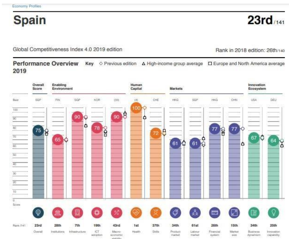
Imagen 6: “España” Extraída del The Global Competitiveness Report 2019