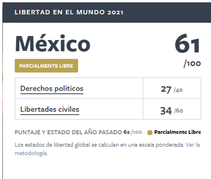
Imagen 2: Extraída del informe Freedom in the world elaborado en 2020 por Freedom House.