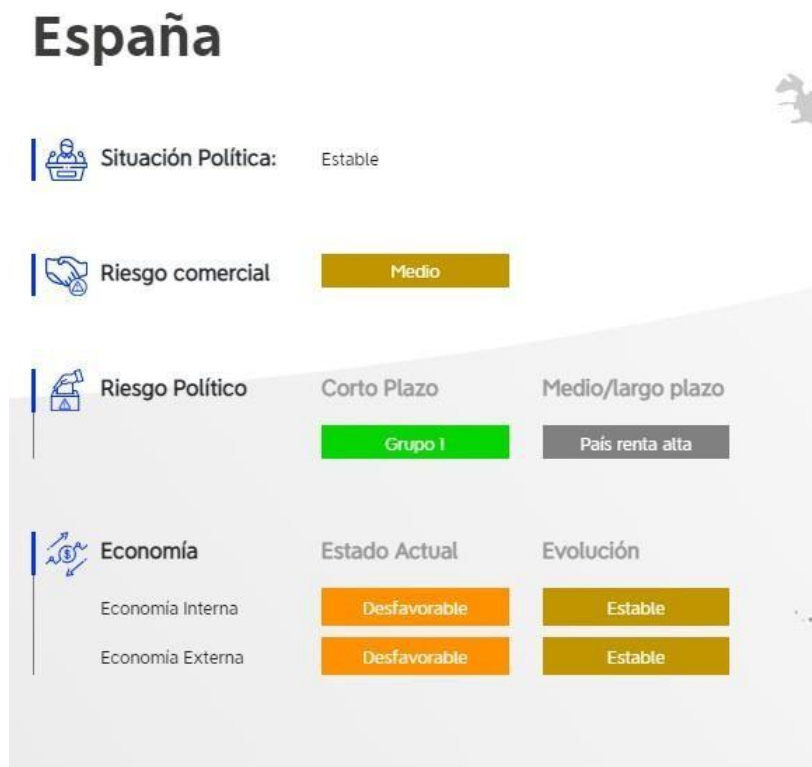
Imagen 3: “España”