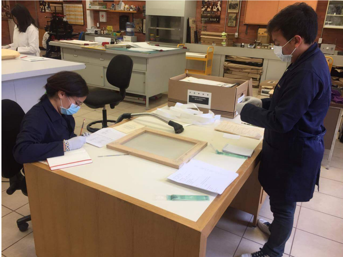
Figura 4.5: Práctica de campo en el laboratorio de conservación del AHUNAM.