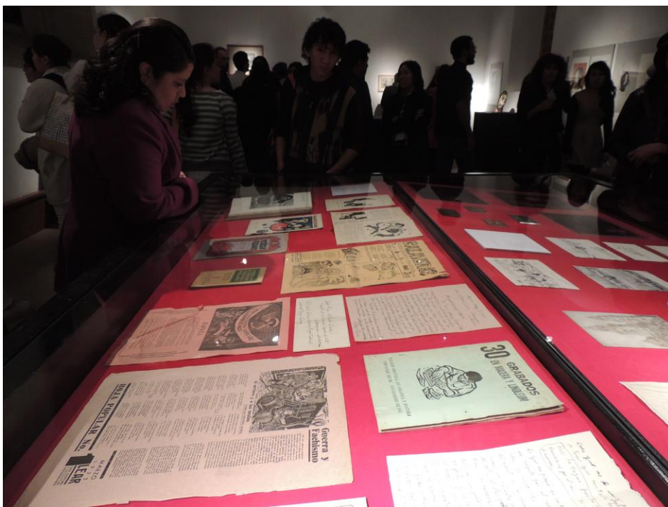
Figura 3.2: Inauguración de la exposición «Alfredo Zalce, lecturas y procesos» en el Centro Cultural Clavijero, Morelia Michoacán.

ENES Unidad Morelia, UNAM. 24 de enero de 2015.