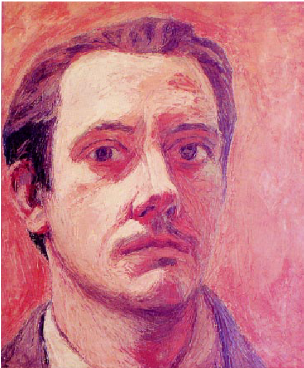
Figura 3.1: Alfredo Zalce. Autorretrato, 1943. Óleo sobre tela. 48x41cm Alfredo Zalce, pintor michoacano, Gobierno del Estado de Michoacán (Morelia, 2000).