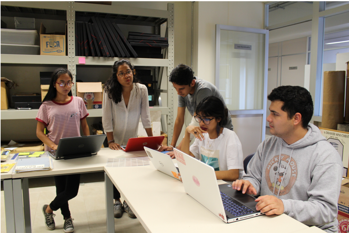
Figura 4.4: Alumnos dialogando sobre las condiciones de infraestructura que detectaron en la Sala Miantskuarhu