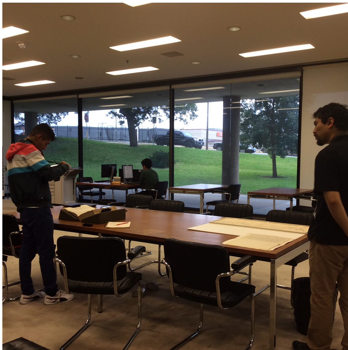
Figura 4.1: Trabajo de campo en la biblioteca Nettie Lee Benson.