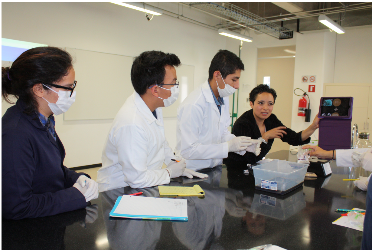
Figura 4.2: Personal del Archivo Histórico Municipal de Morelia impartiendo un curso sobre tintas ferrogálicas.