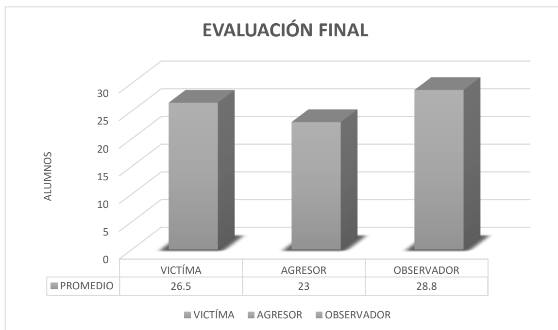
Figura 2. Resultados de la Evaluación Final del Instrumento CEBU

Los resultados de la evaluación final del instrumento CEBU se pueden observar en la figura 2.