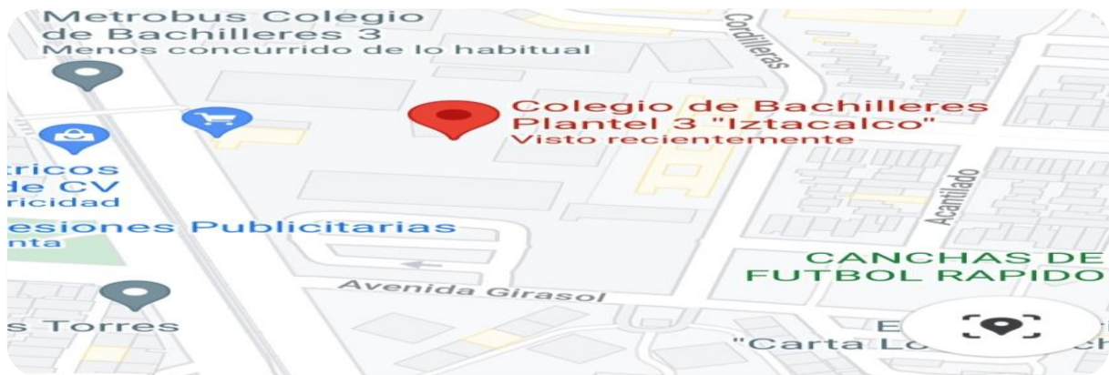
Ilustración 1.- Google. (s.f.). Ubicación de Colegio de Bachilleres 3 Iztacalco. Recuperado el 6 abril de 2021.

El colegio de bachilleres 3 se encuentra ubicado en Eje 3 Oriente Francisco del Paso y Troncoso, 1150, Col. Infonavit Iztacalco, Ciudad de México como lo muestra la siguiente ilustración.