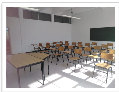
Lámina 3.- Aula

La distribución de los edificios por grado otorga un rango, define el que los alumnos de nuevo ingreso se ubiquen al centro del plantel, para que se sientan cobijados por la comunidad al tener una cercanía con las primarias Anexas, y con los otros grados de la licenciatura. El transitar todos los días entre las altas columnas que sostienen los frontispicios y visibilizar en ellos su historicidad otorga un sentido de pertenencia con la institución; asimismo, el paso de los niños hacia las Anexas, dentro de la Normal, encarna su próxima labor, lo que les hace estar ahí, con quiénes van a interactuar; es un escenario en el cual los espacios familiarizan: la dirección, las bibliotecas, los auditorios, las salas de uso múltiple, los laboratorios, la explanada, el hasta bandera, el servicio médico, etc.