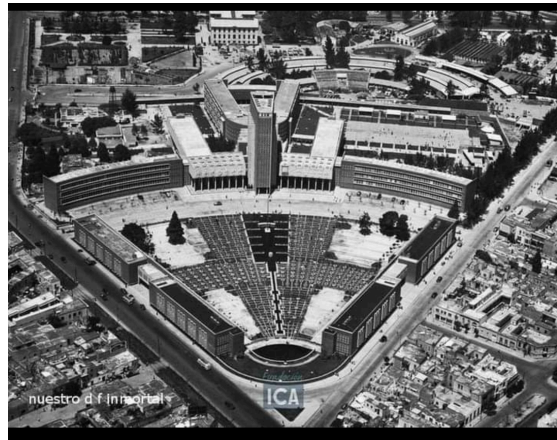
Lámina 2.-Escuela Normal de Maestros 1950, ICA Mexicana

La arquitectura de la BENM con los edificios en forma semicircular, se apega a la técnica de Bentham, la organización reflexiva del espacio colectivo, cuyo objetivo es evitar problemas de emplazamiento y ver con una mirada todo cuanto se hace en ella; en este establecimiento un gran número de individuos se concentra, en consecuencia, salubridad, ventilación y seguridad harán una construcción funcional. El panóptico, es un aparato de individualización y conocimiento a la vez.