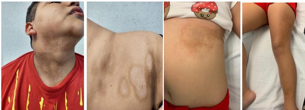
Fotografías tomadas en consulta externa de Reumatología pediátrica previo consentimiento de los padres.

Las áreas más comprometidas fueron el tronco y las extremidades inferiores; 13/15 (86.6%), seguido de cara; 4/15 (26.1%), extremidades superiores; 3/15 (20%), cuello; 2/15 (13.3%) y cuero cabelludo en 1/15 (6.6%) pacientes. Este subtipo se asoció a múltiples complicaciones estéticas y funcionales, por lesiones múltiples y compromiso en cara.