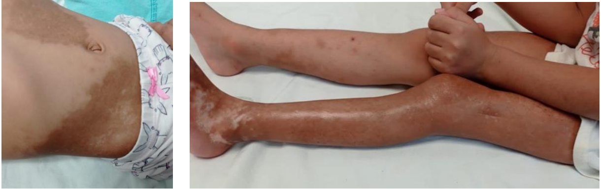
Fotografías tomadas en consulta externa de Reumatología pediátrica previo consentimiento de los padres.

Todos los pacientes con esta forma de esclerodermia presentaron compromiso en tronco y en miembros inferiores; 4/36 (11.1%), solo un paciente presentó afectación del cuello.