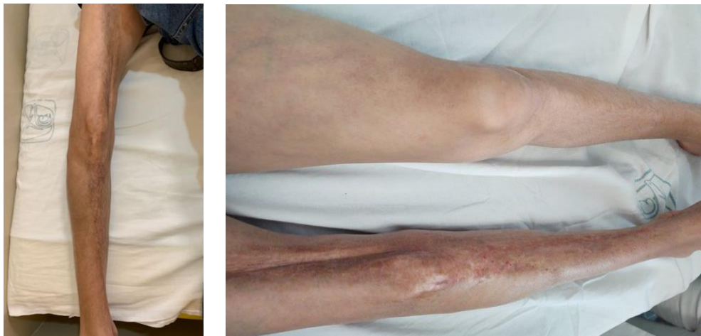
Fotografías tomadas en consulta externa de Reumatología pediátrica previo consentimiento de los padres.

Fue el subtipo menos frecuente, se presentó en 2/36 pacientes (5.5%). Ambos tuvieron compromiso funcional articular y alteraciones estéticas por afectación en extremidades inferiores, predominando la asimetría de miembros inferiores.