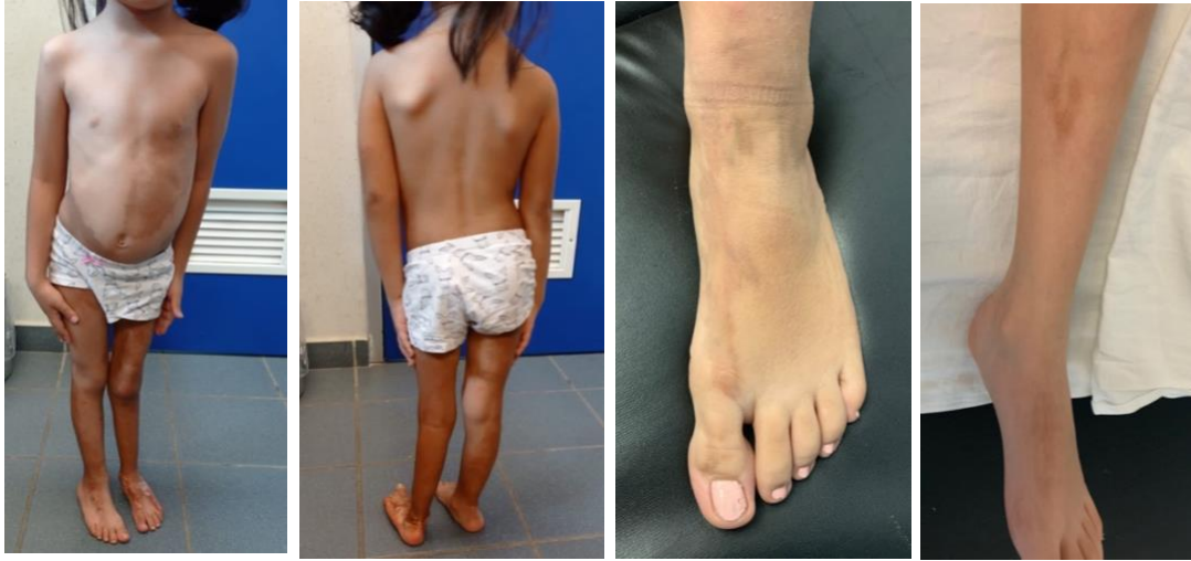
Fotografías tomadas en consulta externa de Reumatología pediátrica previo consentimiento de los padres