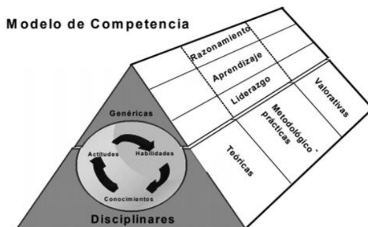
Gráfico 3. Modelo de perfil por competencias de la FES Zaragoza.