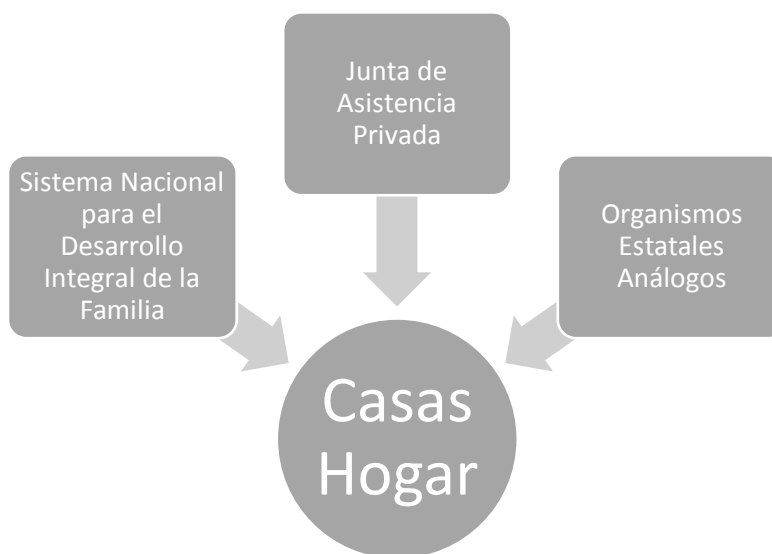
Gráfico 2. Organismos administrativos de Casas Hogar en México.