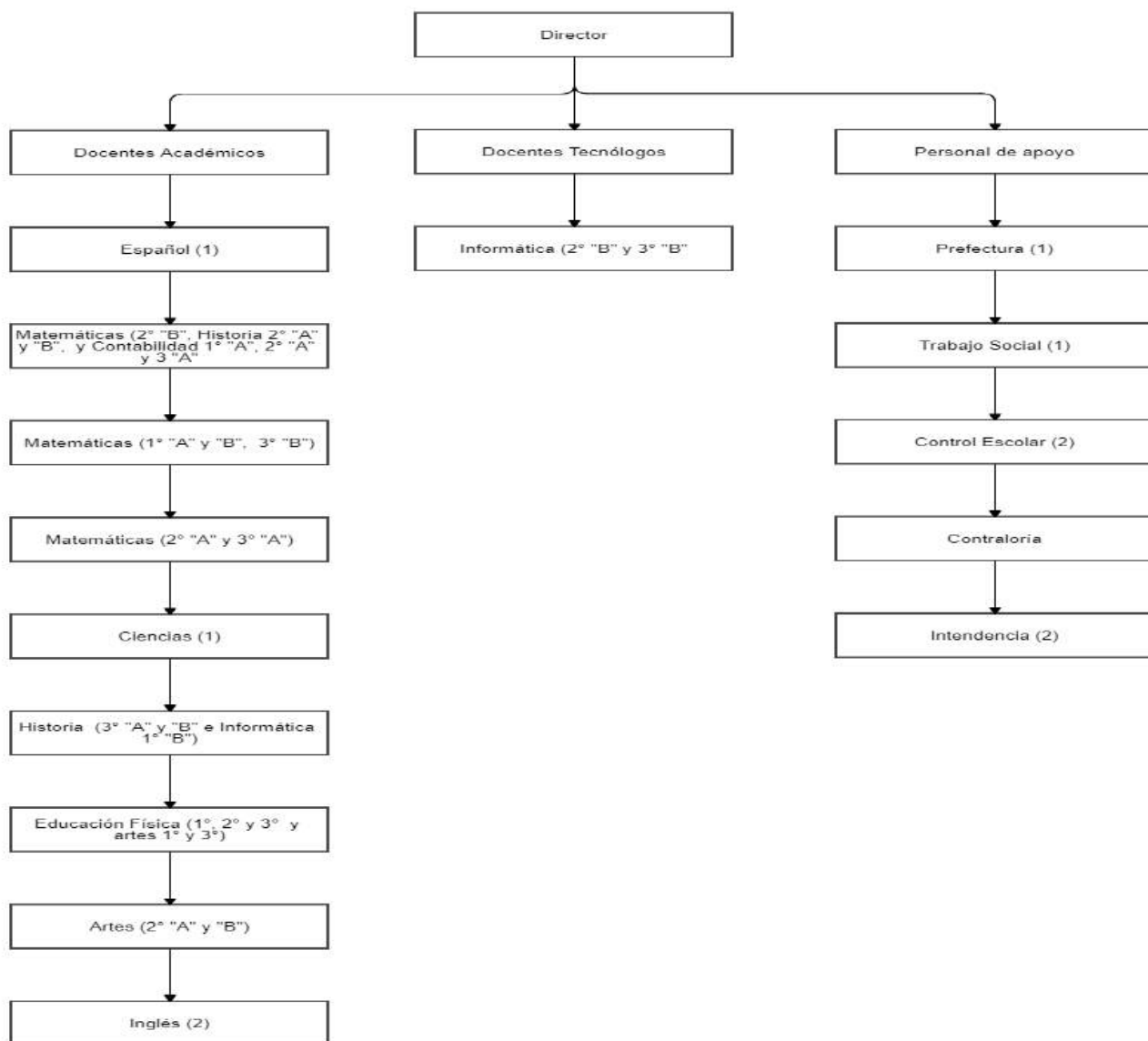
Figura 3. Organigrama de la Escuela Secundaria Técnica Número 238