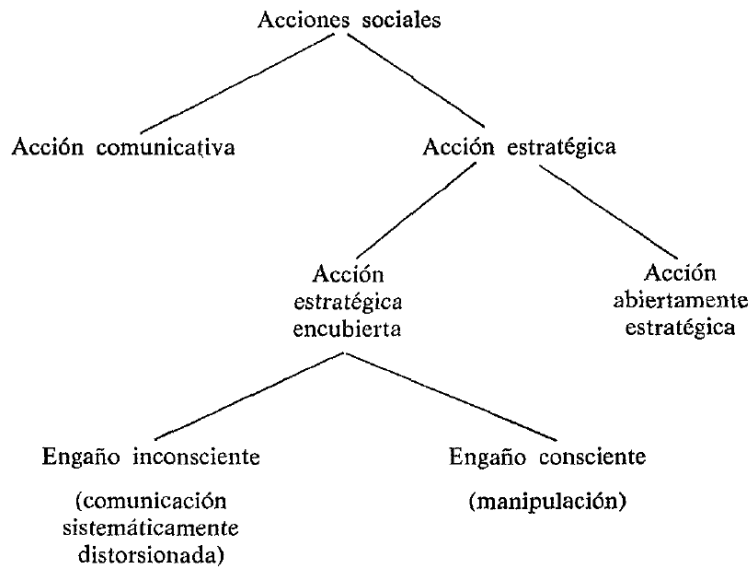
Figura 4 Variantes de la acción estratégica. 178

- Acción regulada por normas : se refiere no a las actividades individuales de un sujeto frente a otros, sino a los miembros del grupo social que dirigen su acción por valores comunes. “Las normas expresan un acuerdo existente en un grupo social. Todos los miembros de un grupo para los que rige una determinada norma tienen derecho a esperar unos de otros que en determinadas situaciones se ejecuten u omitan, respectivamente, las acciones obligatorias o prohibidas. El concepto central de observancia de una norma significa el cumplimiento de una expectativa generalizada de comportamiento...Este modelo normativo de acción es el que subyace a la teoría del rol social.” 179 En esta, el individuo tiene un relación con dos mundos, el primero es el mundo objetivo de estados de cosas existentes y el segundo es el mundo social a que pertenece donde es portador de un rol, fijado por un contexto normativo que establece las interacciones sociales que se consideran legítimas. “Y todos los actores para quienes rigen las correspondientes normas (por quienes éstas son aceptadas como válidas) pertenecen al mismo mundo social. Así como el sentido del mundo objetivo puede aclararse por referencia a la existencia de estados de cosas, así también el sentido del mundo social puede aclararse por referencia a la vigencia de normas.” 180