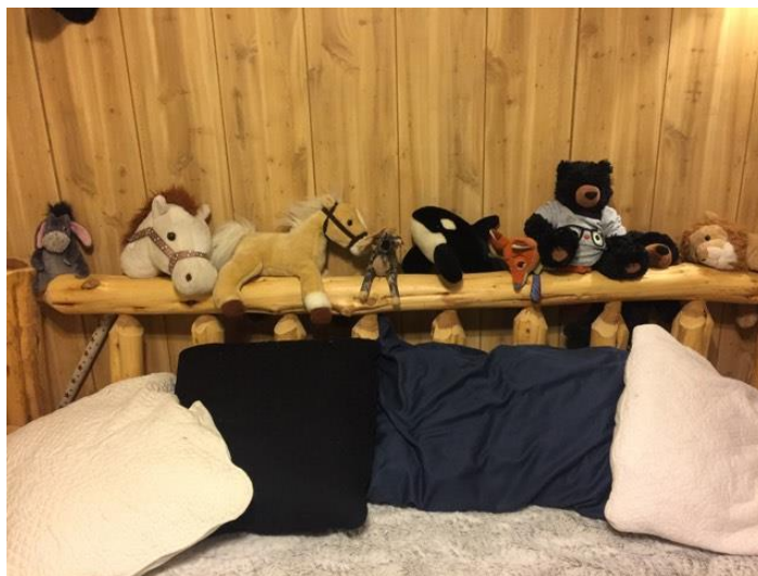
14. Colección especial de animales de peluche de Daniel.