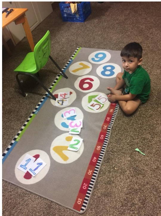
10. Daniel identificando series de números y agrupando por similitud de cifra.

Tras algunas semanas de actividades relacionadas a las cifras numéricas, Daniel fue capaz de contar del 1 al 10 de manera progresiva creciente sin dificultad y sin ningún error. En las imágenes algunas de las actividades relacionadas a las cifras numéricas del 1 al 10. Donde encontramos un tapete numérico, se usaba en diferentes prácticas, brincar de número par a número par, cómo twister (juego lúdico, motriz y sensorial), creación de su propio juego memorama por pares y colores y la identificación por cifras iguales.