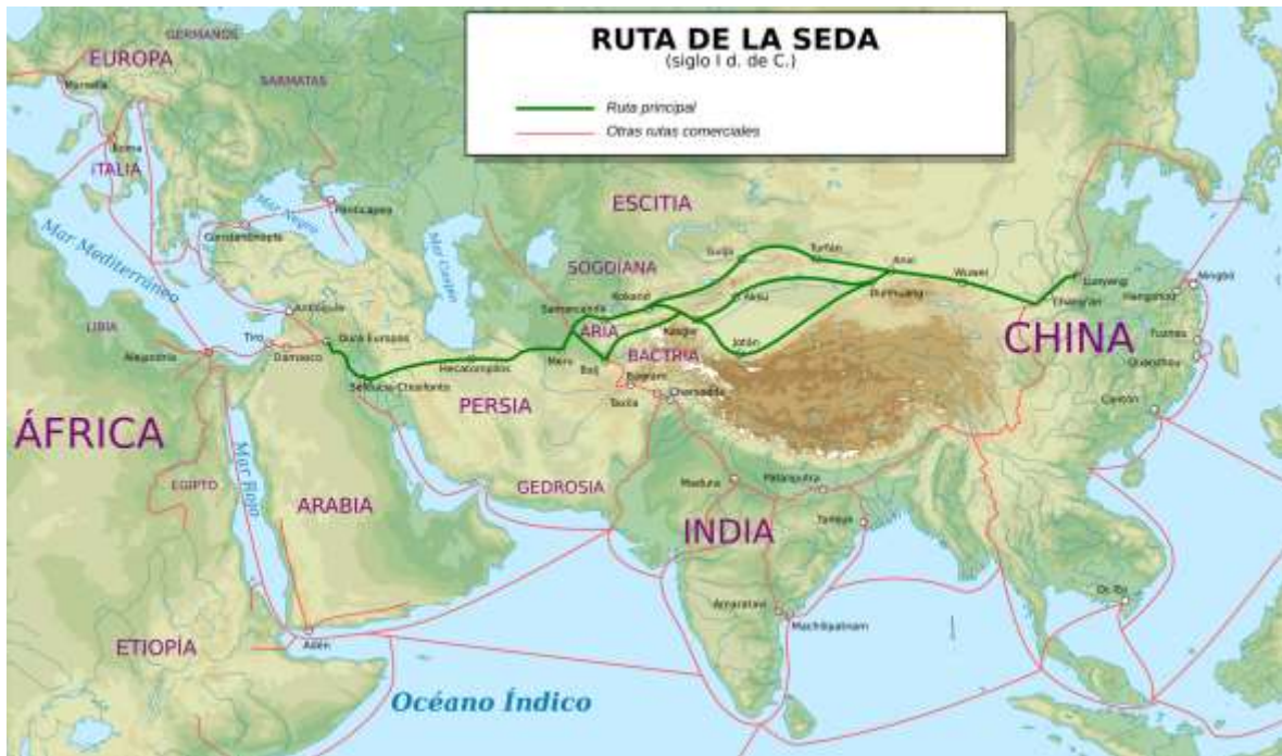
Ilustración 13 El mapa muestra las ciudades que cruza la ruta de la seda. La línea verde muestra la ruta principal, mientras que la línea roja muestra otras rutas alternativas. En el mapa puede observarse que dentro de las paradas principales se encuentran la ciudad de Kokand y Samarcanda en Uzbekistán, así como Merv en Turkmenistán. 147

De esta manera comenzaron a implantarse dentro de las sociedades de esas regiones en distintas actividades delictivas, “apoyando” así la activación de las economías de estos países tan inestables, pero también se fueron aprovechando de la inestabilidad política para poder influir en las decisiones penalizando algunas acciones ilegales que cometían.