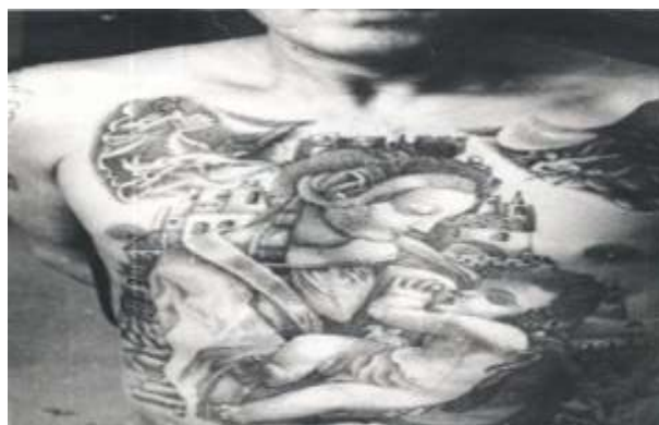
Ilustración 5 Virgen sosteniendo a un bebé suele significar que se trata de un delincuente desde muy temprana edad o que se tiene un hijo 31

Entre los tatuajes más utilizados están la rosa, que solía ser el primer tatuaje del criminal, significaba una juventud arruinada; la virgen con un bebé (ver ilustración 5) tenía un significado un poco similar, podía significar que era un delincuente desde muy joven o que se tenía un hijo en prisión. El tatuaje de las manos abiertas con una flor sobre ellas también solía representar a un criminal que desde muy joven había permanecido en la cárcel. 30