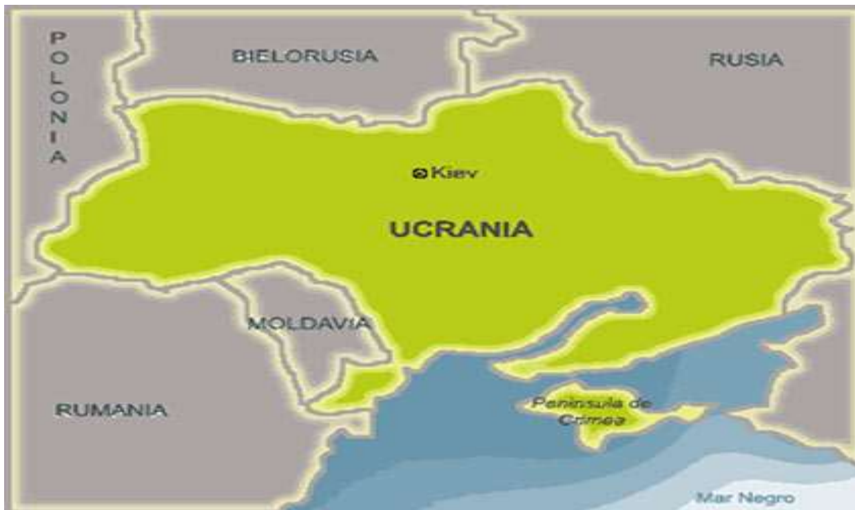
Ilustración 11 El mapa muestra los países con los que comparte fronteras Ucrania, entre los cuales se encuentra Bielorrusia, Polonia, Moldavia, Rumania, Eslovaquia y Hungría. En el mismo sentido se muestra la Península de Crimea, región geográfica por la cual tuvo conflictos con la Federación Rusa. 130