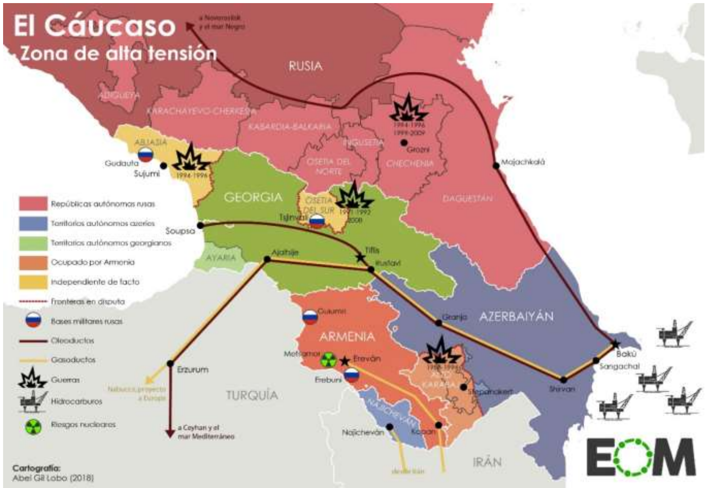
Ilustración: el mapa muestra la división de las distintas ocupaciones de los grupos étnicos en el Cáucaso y fronteras en disputa; asimismo se puede observar las rutas de los oleoductos.

Por otro lado, estaba en cuestión qué condición tendrían en ese momento de cambios las repúblicas que integraban la Unión Soviética, el presidente Gorbachov propuso un Nuevo Tratado de Unión, con el fin de no dejar fuera a las Repúblicas, la propuesta se basaba en realizar una confederación, una unidad entre Estados soberanos para ir más allá de los derechos y sus autonomías, pero sin transgredir el espacio político y económico común. Este Nuevo Tratado sería presentado el 20 de diciembre de 1991, pero el 8 de diciembre del mismo año Ucrania, Bielorrusia y