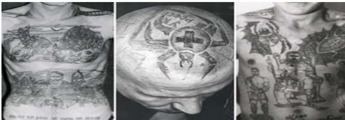
Ilustración 6 muestra la daga atravesada en el cuello, representando asesinos a sueldo y la telaraña, representando problemas con las drogas. 42

el que mata cuando se le ordena. 39 Las calaveras en los dedos, representan a las personas asesinadas, una por cada persona victimada 40 , si debajo de las calaveras tienen dos huesos cruzados, generalmente representa que están cumpliendo cadena perpetua. 41