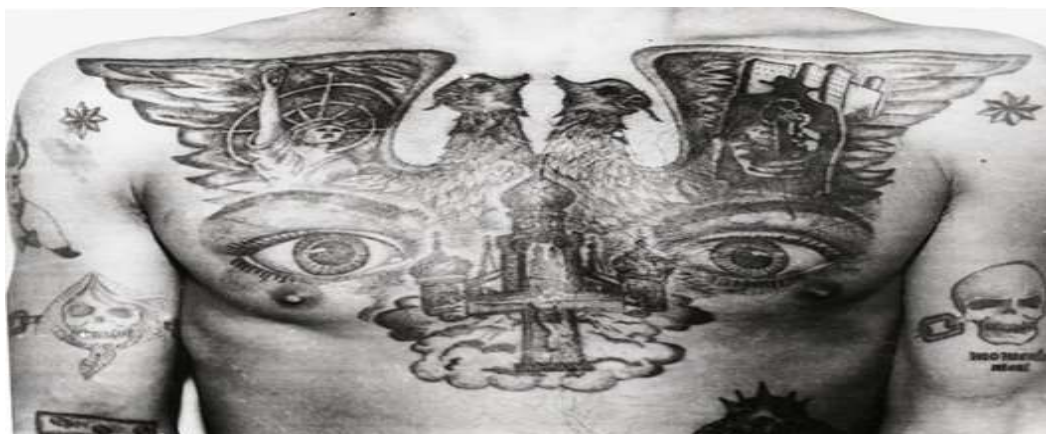
Ilustración 7 los ojos en el pecho suelen representar a un traidor, asimismo representa a un delincuente muy observador. 51

En cuanto a los símbolos sexuales, pueden tener dos contextos, evidentemente reflejan alguna representación sexual, pero también suelen reflejar que el delincuente fue sometido a humillación por tener deudas que no pagaba, por ejemplo: las mujeres desnudas suelen representar a un estafador 47 , al igual que el tatuaje del vuelo del dragón, representando fraude financiero, generalmente aparecen en pecho y espalda. Los ojos en el pecho (ver ilustración 7) pueden representar a un traidor; 48 también suelen representar que el delincuente que lo porta está observando todo lo que ocurre a su alrededor y si se encuentran cerca de los genitales o glúteos tiene connotación sexual, especialmente para hombres homosexuales 49 . Las sirenas también tienen un contexto sexual, suele representar pederastia o inclinaciones homosexuales. 50