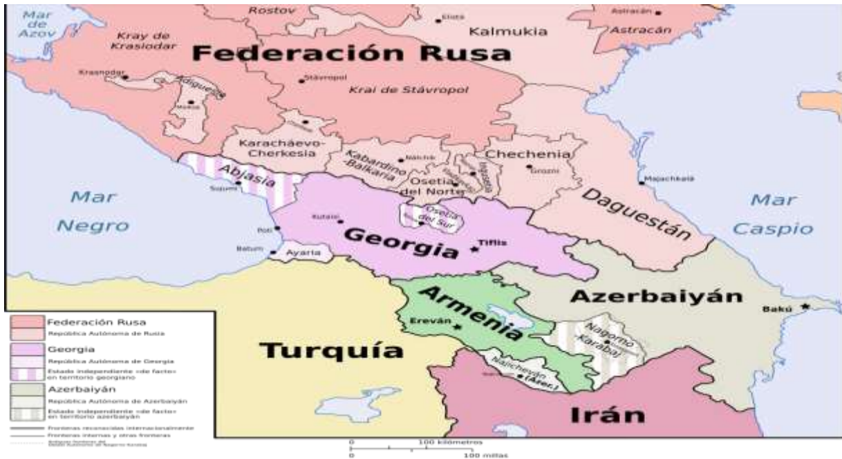
Ilustración 10 El mapa muestra la ubicación geográfica de Chechenia. El color rosado oscuro representa a la nueva Federación Rusa, mientras que el color rosado suave muestra a las repúblicas autónomas de la Federación Rusa, de esta manera puede entenderse mejor el conflicto entre la Federación Rusa y Chechenia por el oleoducto Bakú-Novorossisk, que pasa por Grozni, capital de Chechenia. Asimismo, se observa la frontera entre Chechenia y Daguestán; la Federación Rusa países entre los cuales se presentaron los problemas del extremismo islámico. 126