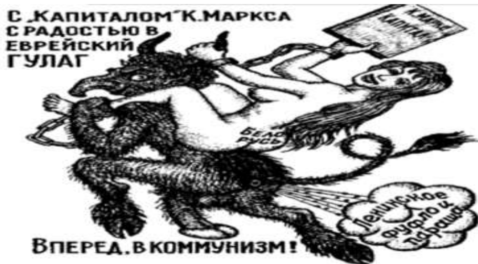
Ilustración 4 Bielorrusa secuestrada. “Con el capital de Karl Marx y una sonrisa al gulag judío”, dice el texto superior, mientras la mujer encadenada lleva el nombre de Bielorrusia en su trasero y el pedo del diablo dice: “Las choradas y las tonterías de Lenin” 29

Entre los tatuajes más utilizados están la rosa, que solía ser el primer tatuaje del criminal, significaba una juventud arruinada; la virgen con un bebé (ver ilustración 5) tenía un significado un poco similar, podía significar que era un delincuente desde muy joven o que se tenía un hijo en prisión. El tatuaje de las manos abiertas con una flor sobre ellas también solía representar a un criminal que desde muy joven había permanecido en la cárcel. 30