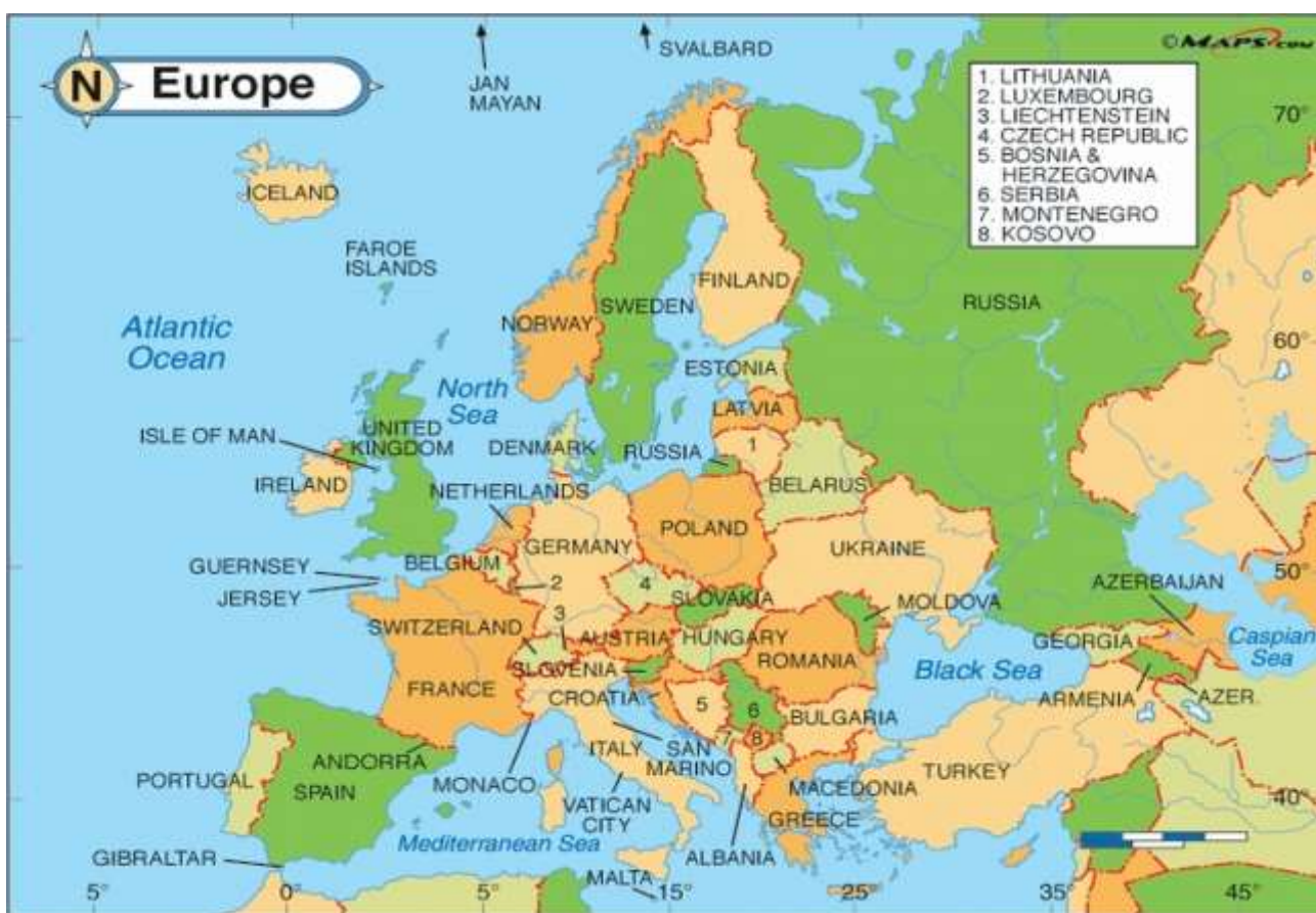
Ilustración 12 El mapa muestra la cercanía entre los países del continente europeo, Rusia y las nuevas repúblicas que se independizaron de la antigua Unión Soviética. 136