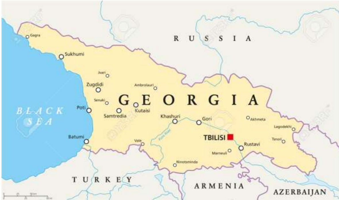
Ilustración 9 La ubicación geográfica de Georgia permitía trasladar mercancías con mayor facilidad ya que tiene una gran superficie con salida al Mar Negro. 121