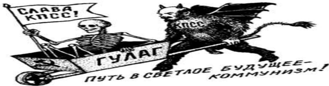
Ilustración 3 ¡Gloria al partido! Tatuaje con referencias sarcásticas al Partido Comunista en el pecho de Lenin y la bandera del esqueleto, cuya carretilla dice “Gulag”. En el texto inferior dice: “¡el camino hacia el brillante futuro del comunismo!” 28

La serpiente también era usada por los altos rangos en la jerarquía, significaba que tenían poder dentro de la organización. También solían realizarse tatuajes con frases como: “No me despiertes”, en los párpados de aquellos que tenían un alto rango y que no debían ser molestados. El tatuaje de Lenin o Stalin normalmente lo llevaba el jefe de un clan, se realizaban en el pecho o partes débiles 27 , ya que, en caso de ser golpeados por los guardias, estos no lo hacían sobre las imágenes de poder; pero como ya se mencionó, también la imagen de Lenin y Stalin solían representar su descontento a la autoridad, depende de qué otros dibujos acompañen la imagen de estos líderes.