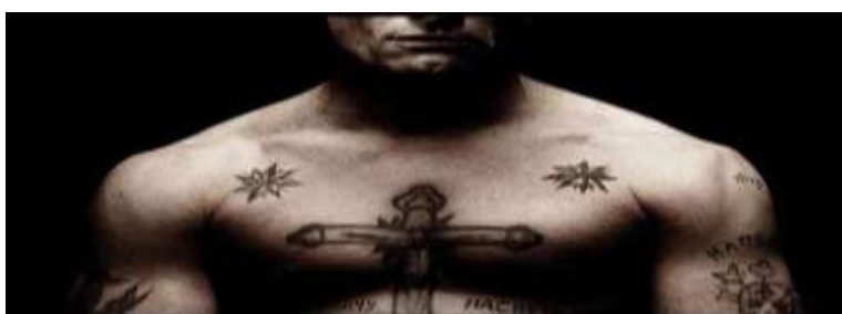
Ilustración 1 estrellas en los hombros representando a un criminal con estatus dentro de la organización. 25

Ya dentro de las organizaciones mafiosas, los tatuajes tenían una función en adición a las ya mencionadas; se utilizaban para mostrar qué lugar ocupaban dentro de la organización, aparte del dibujo, la zona del cuerpo donde se realizaban el tatuaje revelaba mucho acerca de su rango, por ejemplo: la cruz con un Cristo representa al líder de una organización criminal. Las estrellas en las rodillas, hombros o codos (ver ilustración 1 y 2), representan que no se arrodillaban ante la autoridad, cada estrella podía representar muchas cosas, como el lugar jerárquico, cantidad de personas asesinadas o años en prisión; solían ir ganando una estrella conforme iban adquiriendo prestigio y autoridad.