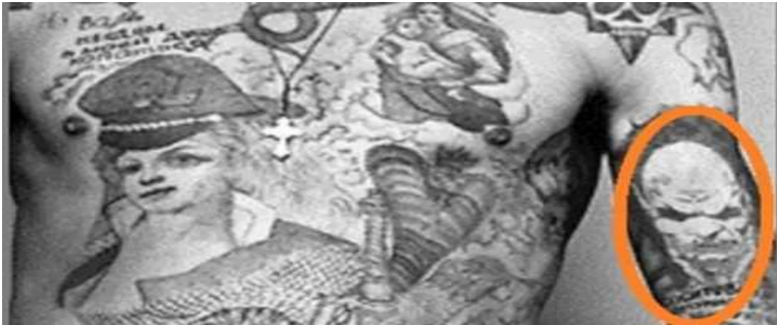
Ilustración 8 demonio representando odio a cualquier tipo de autoridad. 55

Los demonios (ver ilustración 8), generalmente solo se representan con rostros y reflejan el odio hacia la administración penitenciaria y cualquier tipo de autoridad 53 . De manera similar, la esvástica nazi, representa rebelión contra la autoridad penitenciaria rusa 54 .