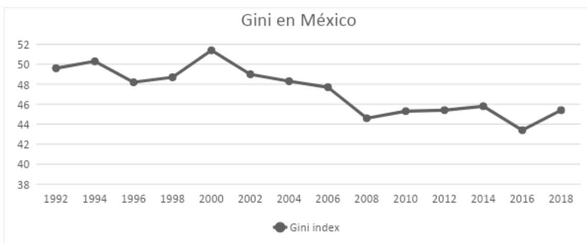
GRÁFICO 1. EVOLUCIÓN HISTÓRICA DE LA DESIGUALDAD EN MÉXICO