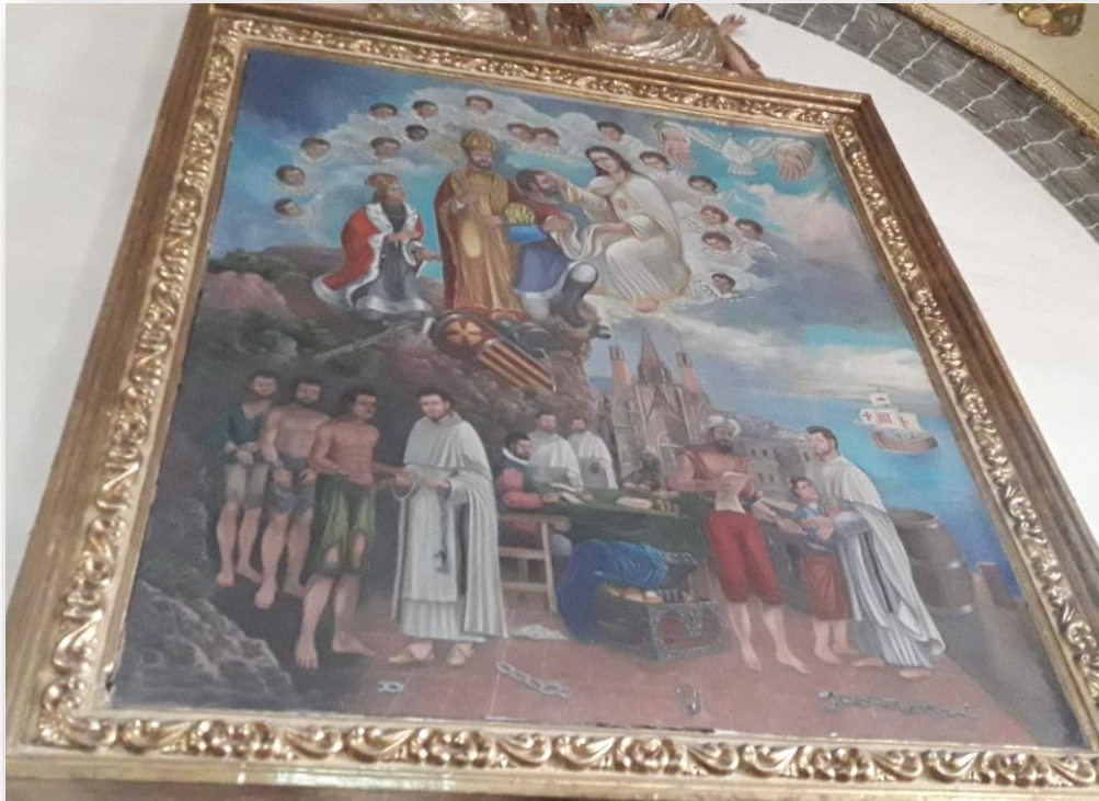
(3) Origen de los mercedarios

En la parte superior de la fotografía se puede apreciar a la virgen de la Merced tocando la cabeza de quien se podría suponer sea San Pedro Nolasco (fundador de la orden) y del lado izquierdo a Jaime I rey de España y de Aragón quien dio el permiso para la fundación de la orden.