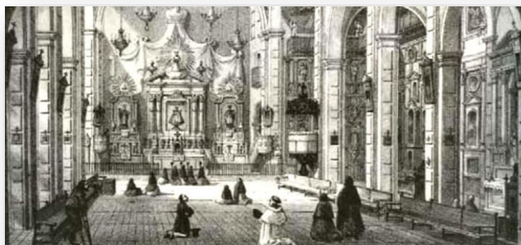
(5) Interior de la catedral de Nuestra Señora de la Merced en la capital de la Nueva España

En la parte inferior izquierda se puede apreciar el dibujo de un fraile mercedario acompañado de un hombre vestido de negro.