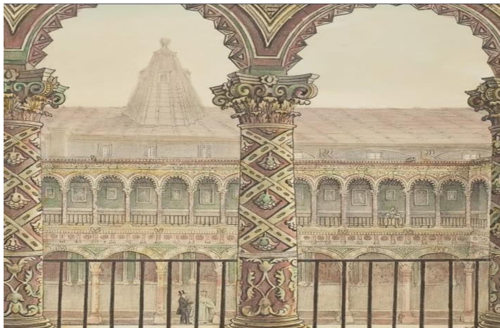
(4) Fachada del ex convento y catedral de la Merced

Como se mencionó en distintos apartados de esta investigación el ex convento y catedral de la Merced se localizan en lo que hoy se conoce como el barrio de la Merced en la capital del país, es interesante mencionar que, según los comentarios de algunos frailes del convento de Belem la figura piramidal que se observa en la parte superior izquierda corresponde a lo que se puede considerar como la cúpula del templo religioso.