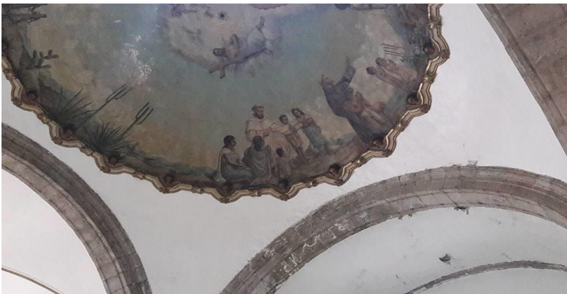
(2) Fray Bartolomé evangelizando

En la presente fotografía se puede apreciar a Fray Bartolomé de Olmedo evangelizando a un grupo de infantes indígenas.