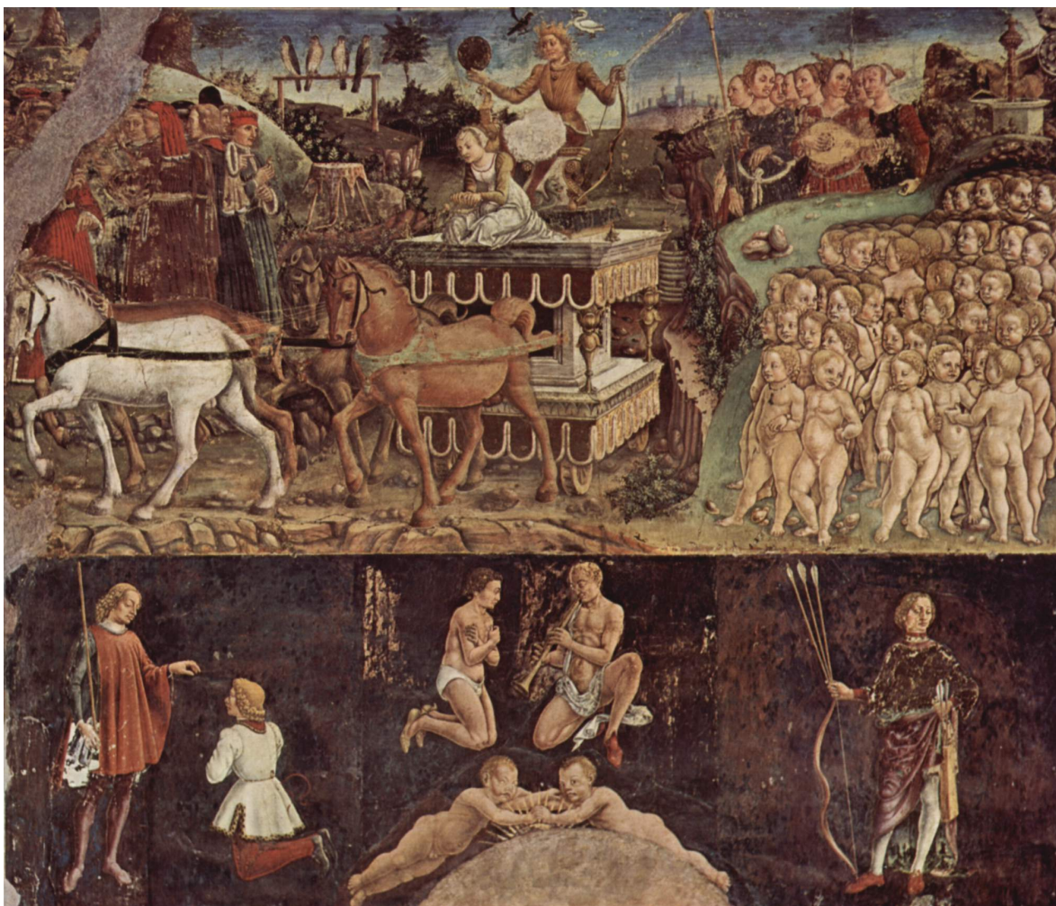
Figura 3. Francesco del Cossa, Triunfo de Apolo (detalle), 1469-1470, fresco, Palacio Schifanoia, Ferrara, Italia. Acervo Museo Schifanoia, Ferrara, Italia.

e iconográficamente” hasta el quattrocento pero al mismo tiempo, un ejemplo del “embuste pseudo-matemático” o “fetichismo onomástico proyectado al futuro” que durante siglos había hechizado a los hombres. Warburg narra el recorrido que va de la astrología alejandrina hermético-medicinal (de las concepciones astrales de la Antigüedad) a la “funesta herencia común europea” del Astrolabium Magnum (1488) y los trabajos de la corte de Alfonso el Sabio en Toledo. 42