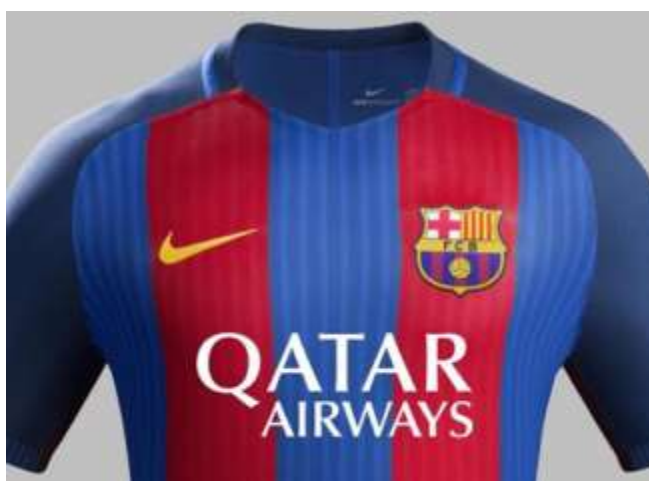
Foto 3. Patrocinio de Qatar en la camiseta del F.C Barcelona.

Fuente: La jugada financiera, La llegada de Rakuten no cierra la puerta a que Qatar Airways siga como sponsor del FC Barcelona , [en línea] dirección URL: http://lajugadafinanciera.com/barcelona-qatar-patrocinio-2017/ , 21 de noviembre de 2016 [consultado el 9 de marzo de 2020].