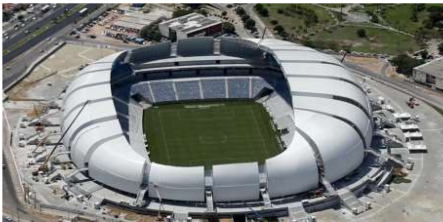
Foto 1. Estadio Arena Das Dunas 118