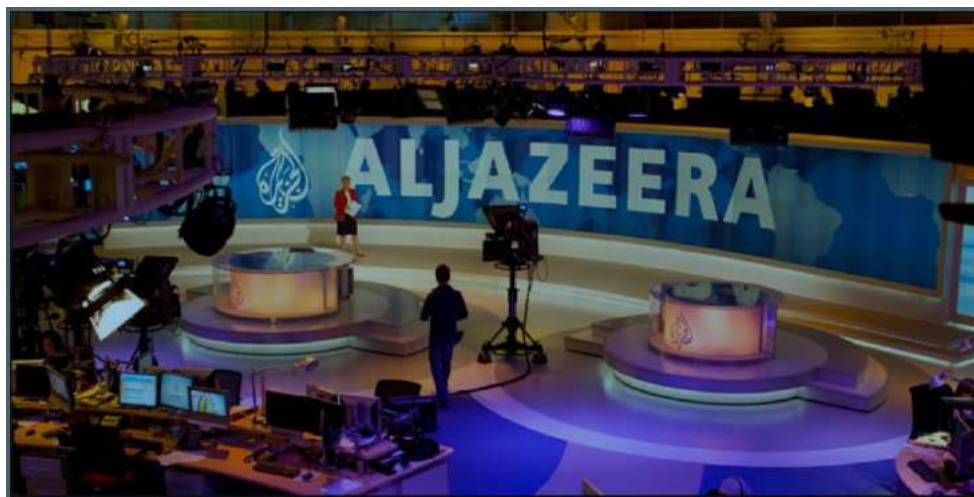
Foto 2. Foro de la cadena Al Jazeera