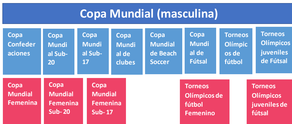
Gráfica 1. Tipos de torneos internacionales regulados por la FIFA