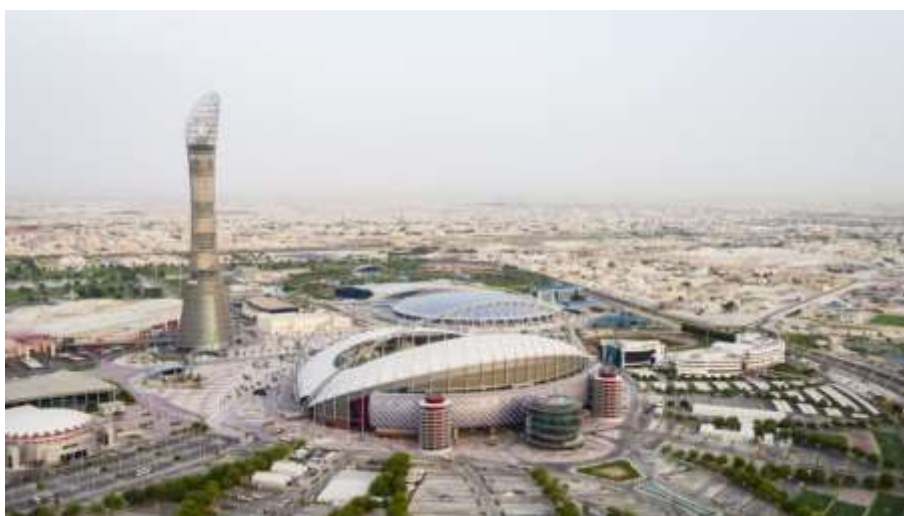
Foto 4. Estadio Internacional Khalifa.

En este estadio con sede en Doha, se llevará a cabo la final del mundial de 2022, tiene una capacidad aproximada de 50 mil personas y cuenta con aire acondicionado dentro del mismo. Fuente: Federación Internacional de Fútbol Asociación, El nuevo campeón del Mundial de Clubes será coronado en el Estadio Internacional Khalifa , [en línea], FIFA, Dirección URL: https://es.fifa.com/clubworldcup/news/el-nuevo-campeon-del-mundial-de-clubes-sera-coronado-en-el-estadio-internacional , 7 de diciembre de 2019 [consultado el 10 de marzo de 2020].