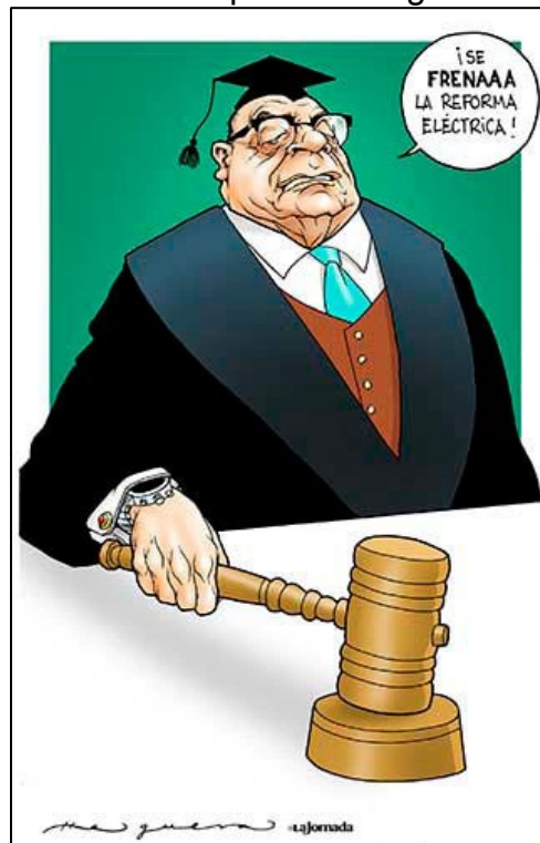
Justicia Imparcial. Helguera

El presidente Andrés Manuel López Obrador señaló categórico: “Con todo y la iniciativa de la reforma constitucional ahora impugnada, enviaré otra reforma que corre el riesgo de ser nuevamente impugnada porque no tenemos mayoría.” 232