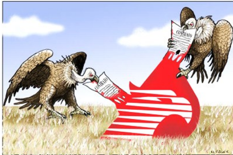
Rapiña Neoliberal. El Fisgón