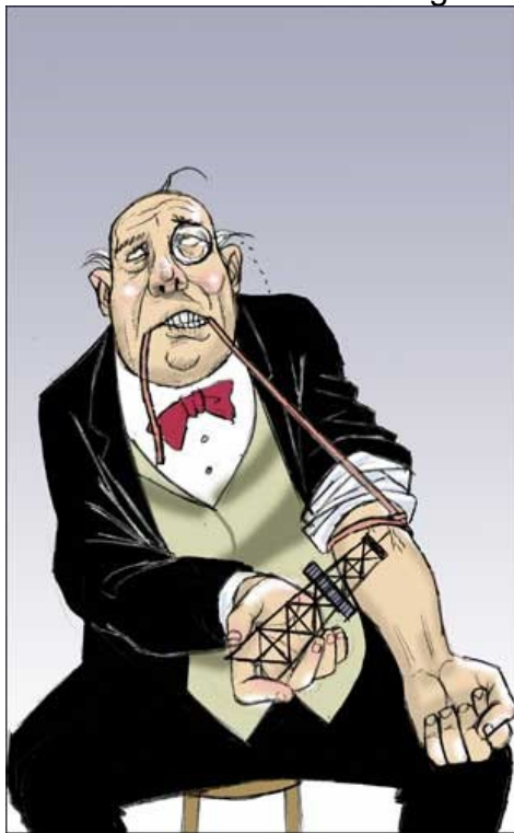
Adicción incurable. El Fisgón

Debido a que el petróleo es un recurso finito y es la columna vertebral de capitalismo mundial, debido a la adicción cada vez más vertiginosa en el uso de este compuesto, es estratégico para las grandes multinacionales y países como Estados Unidos controlar las reservas, 151 manteniendo así un modelo de negocio basado en grandes ganancias a un puñado de empresarios a corto plazo en contra de los intereses de los pueblos y la humanidad. 152