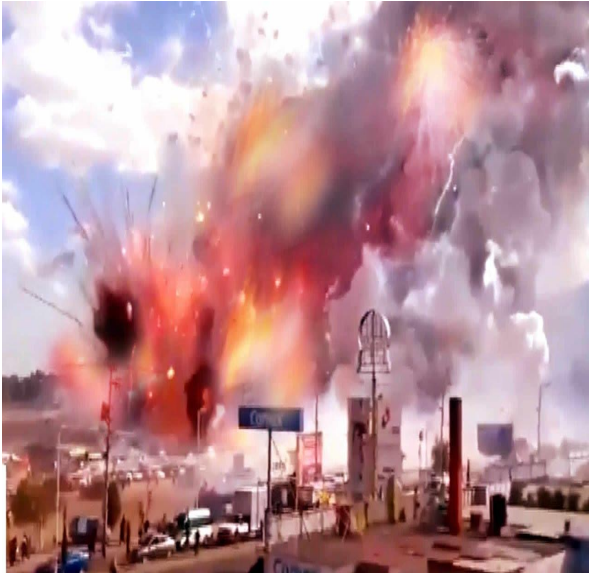
Fotografía de las explosiones el 20 de diciembre de 2016 en el Mercado de Artesanías Pirotécnicas San Pablito 71