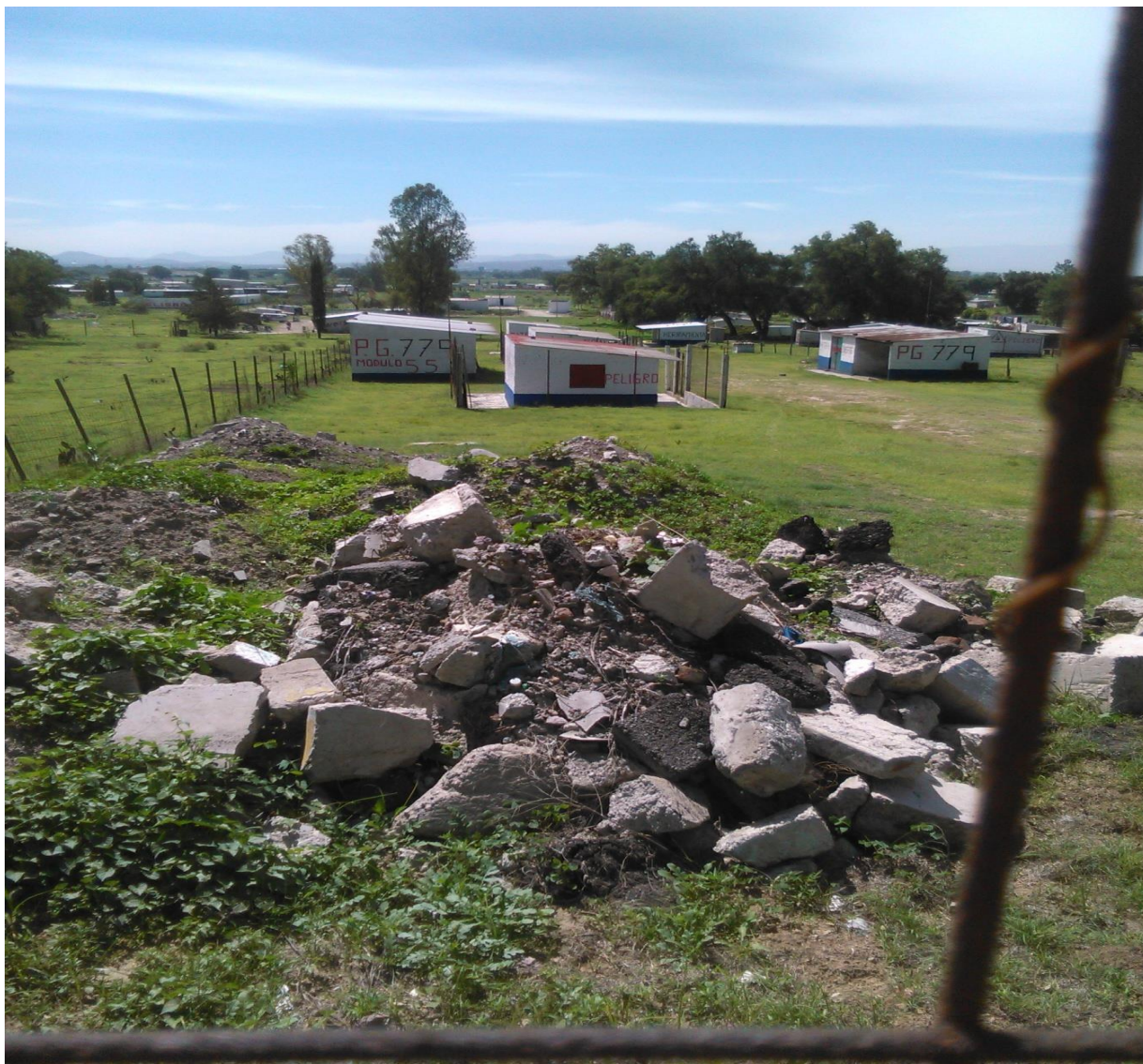
43 “Bodegas y polvorines en la Colonia La Saucera, Tultepec Edo. Méx”