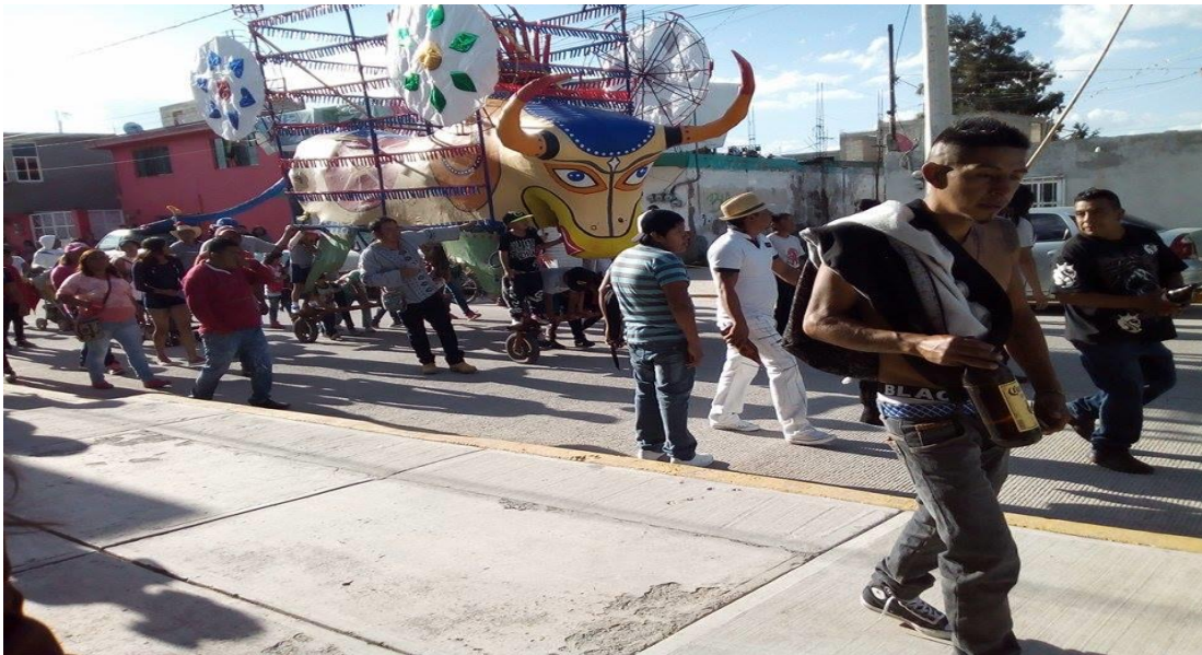
“Torito en el Barrio la Manzana”, Foto propia 55

La pirotecnia es una actividad muy importante entre los pobladores del municipio de Tultepec, los artesanos pirotécnicos de Tultepec nombraron como su santo patrono a San Juan de Dios, lo que creó una gran tradición, así como un impulso artesanal, pues en honor a este Santo se lleva a cabo una feria anual en el mes de marzo, en la que se le ofrecen un sinnúmero de juegos pirotécnicos, castillos, bombas, globos de cantoya y piromusicales, además se realiza un recorrido por las calles del municipio con los llamados “toritos” para exhibirlos y después trasladarlos a la plaza principal donde se queman delante de miles de espectadores, quienes se divierten con estos espectáculos, así mismo se llevan a cabo concursos pirotécnicos, eventos culturales y musicales, sin dejar de lado el aspecto religioso como las misas, peregrinaciones, entre otras cosas. Esta feria recibe el nombre de Feria Internacional de la Pirotecnia desde 1989, a la que asiste un gran número de visitantes, es hoy en día la festividad más popular dentro del municipio. 54