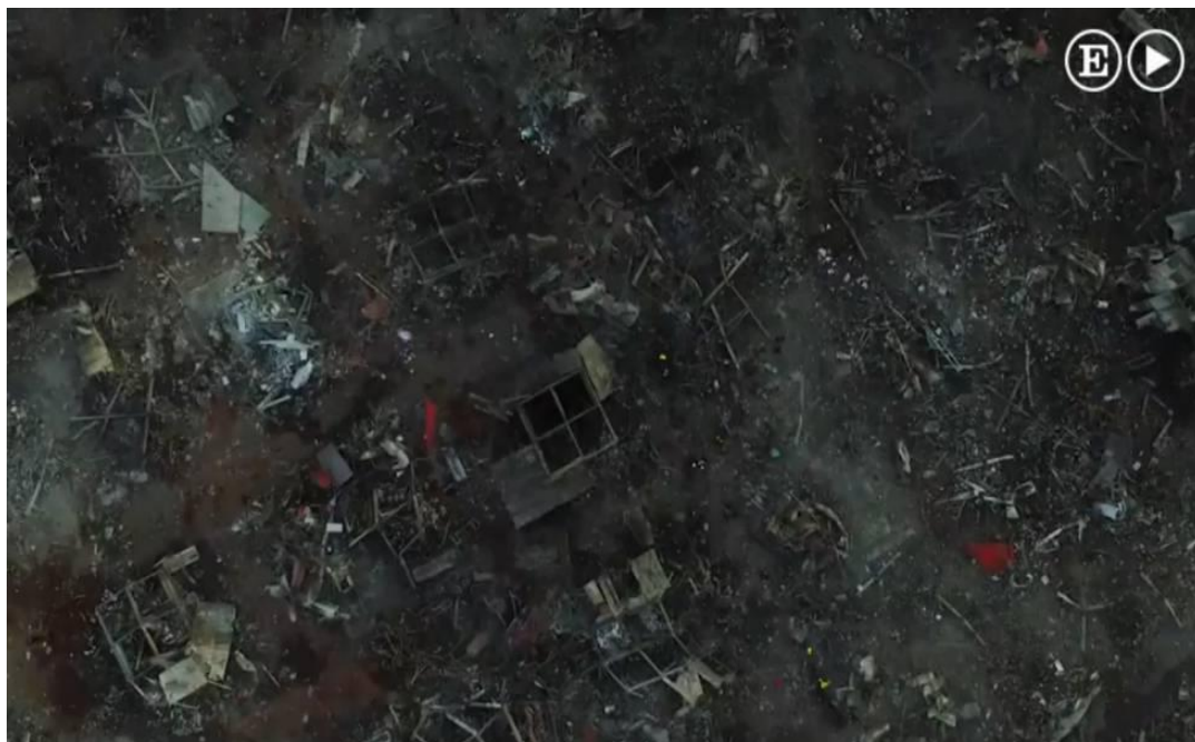
Fotografía después de las explosiones del 20 de diciembre del 2016 en el Mercado de Artesanías Pirotécnicas San Pablito 72