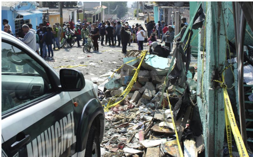
Fotografía de explosión de taller pirotécnico el 04 de marzo de 2017 77