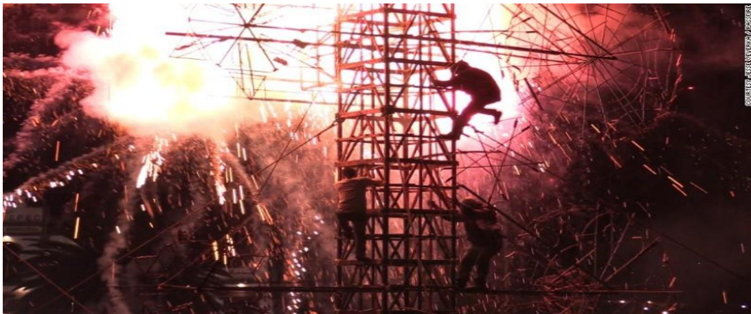
Artesanos encendiendo castillo pirotécnico en Tultepec 52

Otros juegos artificiales peligrosos y complicados son los juegos de día, ya que ofrecen un efecto en el que parece que las figuras que se están quemando tienen movimiento, por otro lado, los piromusicales, estos ya emplean un mecanismo tecnológico, puesto con la ayuda de un software es posible mover las figuras al ritmo de la música. Los globos de cantoya, que son igual a los tradicionales, pero contienen cohetes que los hacen más atractivos, algunos otros son altamente peligrosos como el llamado “grito de Satanás”, el “huevo de codorniz”, que en propias palabras de los artesanos son una bomba, y otros productos considerados como los más sencillos e inofensivos como los “buscapiés”, “cometas” y “escupidores”. 51