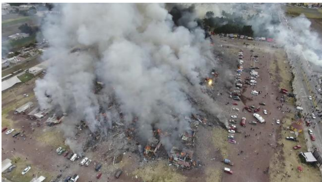
Fotografía después de las explosiones de 2016, en el Mercado de Artesanías Pirotécnicas San Pablito 73