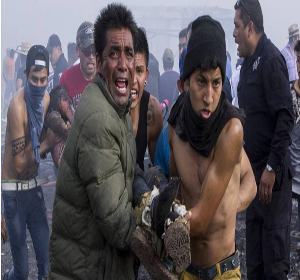
Fotografía prestando ayuda a víctimas de las explosiones del 2016 74

En un lugar como Tultepec, donde la pirotecnia es la principal actividad económica, los accidentes no se hacen presente nada más en el Mercado de artesanías pirotécnicas, sino también en diferentes lugares como en los talleres, depósitos; conocidos como “polvorines”, en la Feria Nacional de la Pirotecnia, en casas, por lo que a continuación se muestran los incidentes de los que se tiene registro en el municipio de Tultepec: