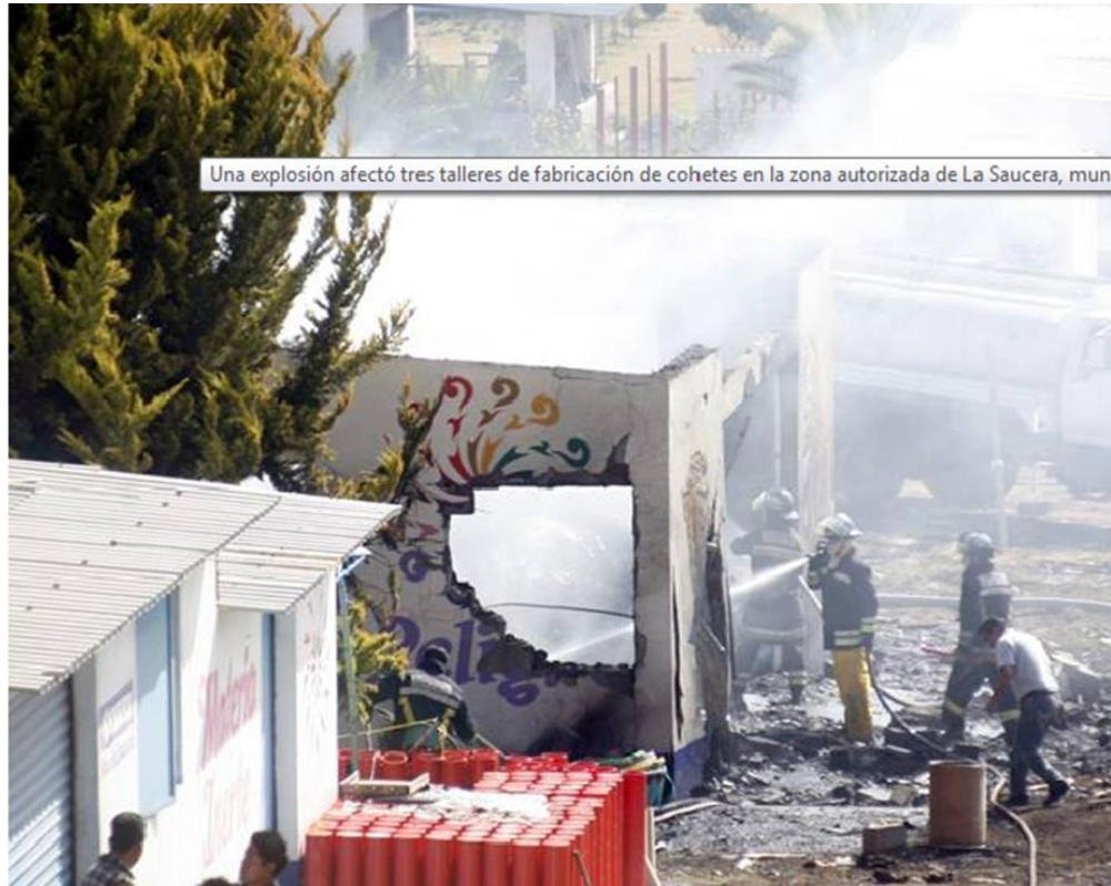
Fotografía del accidente en la Saucera 75