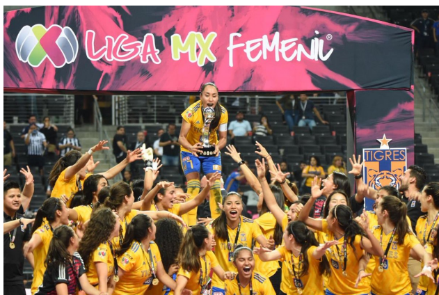
Tigres alza su segundo campeonato

En el Apertura 2019, el ganador fue Tigres, equipo que había ganado en la segunda edición. La final la jugó contra Monterrey y la ganó con 3-2 en el marcador global. De esa manera, el club felino se convirtió en el equipo con más títulos (2) en la Liga MX Femenil.