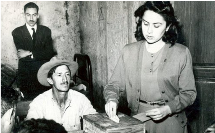
Primeras elecciones en México, 1955

Este gran paso en la historia de la equidad de género en México no podría entenderse sin Elvia Carrillo Puerto (1878-1967), quien fue impulsora del feminismo en el país y una de las principales caras en la lucha para obtener la igualdad respecto a derechos políticos.