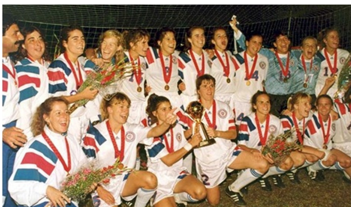
Selección femenil de Estados Unidos en 1991

mundiales, no oficiales, que se llevaron a cabo en 1970 y 1971, los cuales, a pesar de no tener validez, fueron un antes y un después para las mujeres en este deporte (Carreño Maritza, 2006).