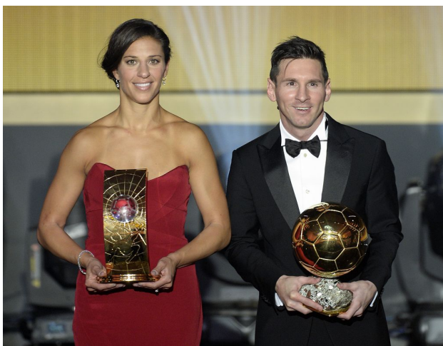
Carli Lloyd y Lionel Messi

El éxito del galardón originó que en 2009 la FIFA homologara su premio creado en 1991, llamado FIFA World Player of the Year (Jugador Mundial de la FIFA), con el Balón de Oro de la revista francesa. Lo anterior duró hasta el 2015, a partir del 2016 la federación, con sede en Suiza, creó el premio The Best FIFA para el mismo fin.