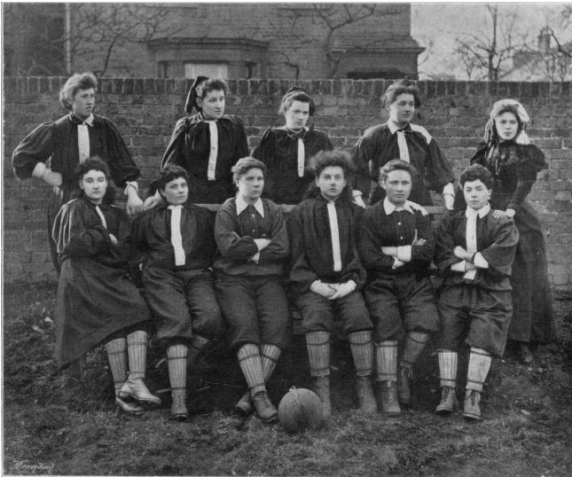
British Ladies Football Club

Según información reportada por FIFA, al partido acudieron más de 10 mil espectadores, lo cual fue un logro para el inédito fútbol femenino de la época. De igual