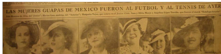
( Excélsior , 1936)

El primer ejemplo es el de una publicación del periódico Excélsior , el cual publicaba en 1936 una nota que decía: “Las mujeres guapas de México