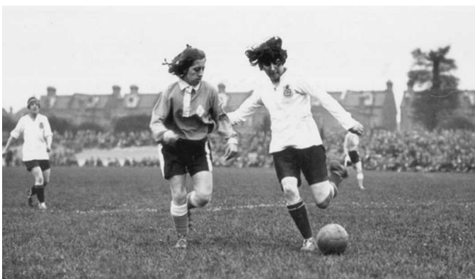
Dick, Kerr's Ladies

Durante esos años (1914-1918), las mujeres inglesas realizaron tareas que nunca habían hecho, como tomar los trabajos de los hombres en fábricas y que derivó en la formación de varios equipos de fútbol entre las trabajadoras. El más popular fue el Dick, Kerr's Ladies de la empresa Dick, Kerr & Co.