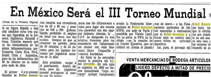
( El Informador , 1971)

En el texto se pueden leer frases como: “Cabe preguntarse también si la práctica de este deporte no representa peligros reales para las mujeres”, “En muchos países el fútbol femenino se ha puesto de moda en los últimos años”, y el cuestionamiento principal “¿Es el fútbol un deporte femenino?”