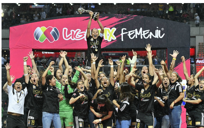
Tigres festeja su primer título en la Liga MX Femenil

El Clausura 2018, segunda edición del torneo, se jugó en el primer semestre de 2018.