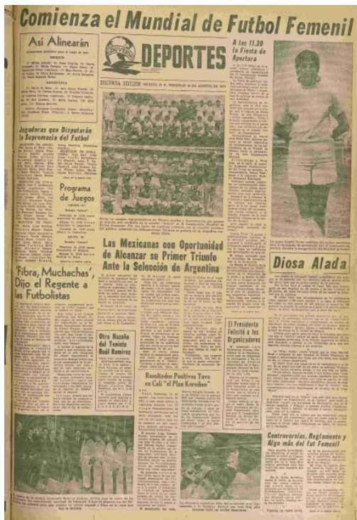
El Universal (eluniversal.com)