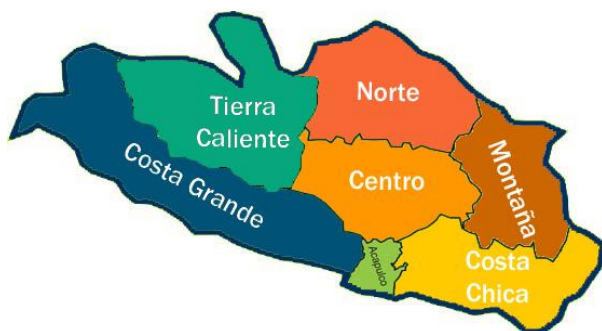
Imagen 1. Regiones de Guerrero.

(Morales, 2015, pág. 262) La mayoría de los artículos sobre la montaña coinciden en que la población que habita en esta región no tiene cubiertos sus derechos económicos y sociales básicos como salud, educación, vivienda y cuenta con niveles altos de desnutrición, siendo la región de Guerrero con el índice de marginación más alto.