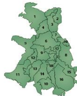
Imagen 2. Municipios de la Montaña Alta de Guerrero.

El contexto cultural y las condiciones socioeconómicas de la Montaña son resultado de un proceso histórico, caracterizado por años de explotación tanto de la naturaleza como de la población. Dice Nicasio (2003) que “los pueblos requieren de las instituciones, no sólo de programas de desarrollo para mejorar sus condiciones de vida, además es necesario respeto y tiempo para conocer a los pueblos” . (pág. 1) Es por ello que se considera que el trabajo social debe llegar a los lugares alejados y mayormente explotados por el Estado, no porque las comunidades realmente necesiten a las instituciones oficiales y a los profesionales para vivir, pues ellas han vivido sin estas, sino para contribuir con el fortalecimiento, asesoría y organización de sus procesos sociales para el caso de las brigadas, tan necesarios en el difícil y desgastado contexto social.