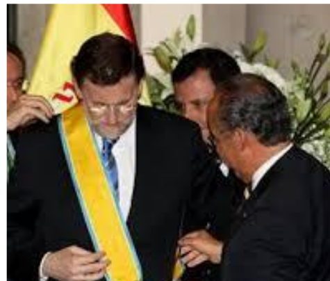
2. Banda en Categoría Especial