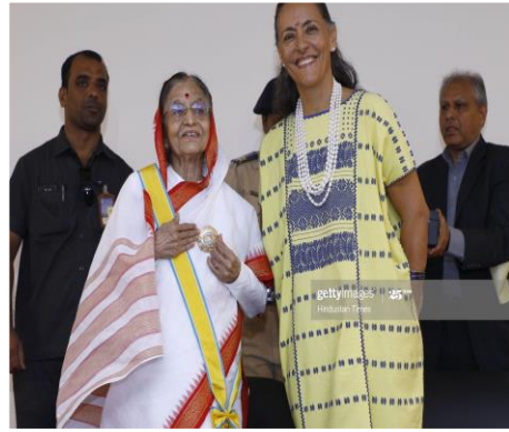
2. Banda en Categoría Especial