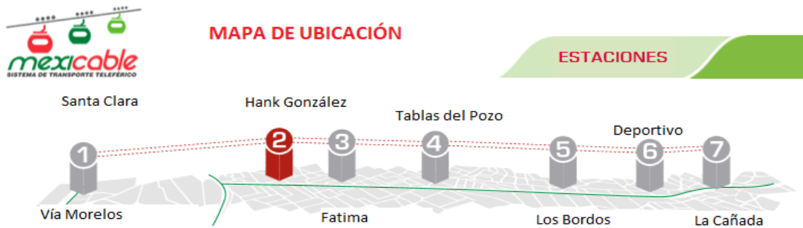
Recorrido del Mexicable de la estación 1 a la 7. Imagen elaborada por Miriam Susana Echeverría Aldana a partir de fotos tomadas de las placas del teleférico, agregándole nombre de las estaciones.

Otra de las ventajas que trajo este medio de transporte es generar empleos que mejoran las condiciones económicas de sus habitantes, también es un beneficio para que estos mismos empleados no tengan que trasladarse a la Ciudad de México en busca de oportunidades.