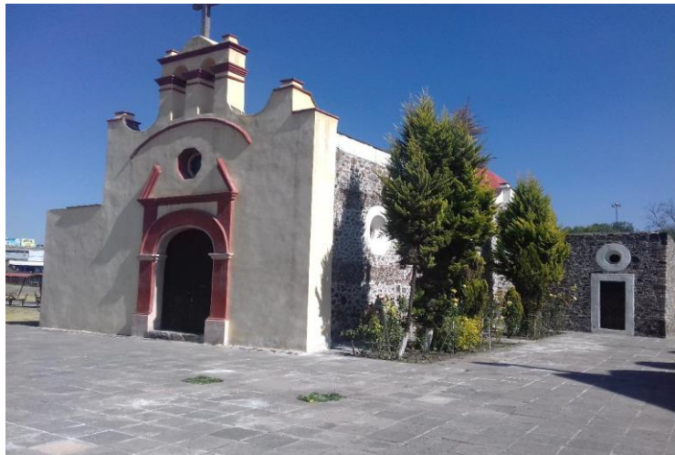
Parroquia del Centro Comunitario. Foto tomada por Miriam Susana Echeverría Aldana el día 22 de enero de 2019.

También cuenta con un temazcal el cual tiene una tradición con arraigo histórico, es una ceremonia del México Antiguo y es una herencia cultural y espiritual, en ella se manifiestan todos los modelos de educación y responsabilidad para encontrarse y educar a las nuevas generaciones con conciencia y compromiso. Este Centro Comunitario también cuenta con una parroquia la cual será utilizada para sala de conciertos y su inauguración fue el 14 de febrero del 2019, las presentaciones no tuvieron costo.