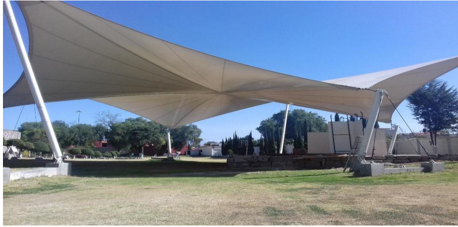
Centro Comunitario Ecatepec Casa de Morelos.

También cuenta con un temazcal el cual tiene una tradición con arraigo histórico, es una ceremonia del México Antiguo y es una herencia cultural y espiritual, en ella se manifiestan todos los modelos de educación y responsabilidad para encontrarse y educar a las nuevas generaciones con conciencia y compromiso. Este Centro Comunitario también cuenta con una parroquia la cual será utilizada para sala de conciertos y su inauguración fue el 14 de febrero del 2019, las presentaciones no tuvieron costo.