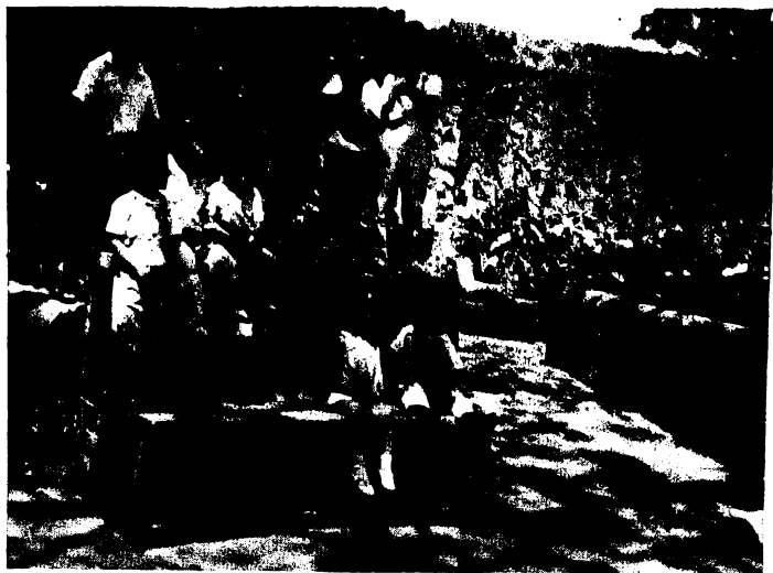
Un grupo de niños en los Jardines del Museo de Churubusco se muestran contentos.

Al día siguiente se les dio expresión libre y los niños con su imaginación y fantasía, dibujaron lo que más les llamó la atención; una niña dijo que iba a hacer la cama del Sr. Juárez y otros niños dibujarían los demás objetos que se encuentran en el Museo.