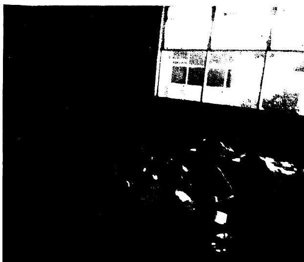
Aquí se muestra a unos niños trabajando en actividad de expresión libre.

También hay secciones escolares en otros museos como el de Antropología e Historia; sin embargo sería conveniente que todos los museos contaran con este servicio que es indispensable para que los alumnos aprovechen al máximo las visitas.