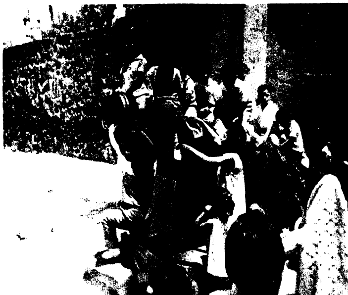
Los niños al salir del Museo de Churubusco.

La mayoría de los niños dibujaron carros y carruajes, los otros niños dibujaron jardines o prados y muy pocos dibujaron el Museo, que representaron con una casa.