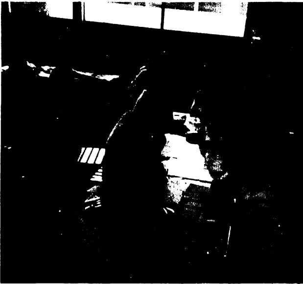
El grupo Trabajando; Actividad de expresión libre.