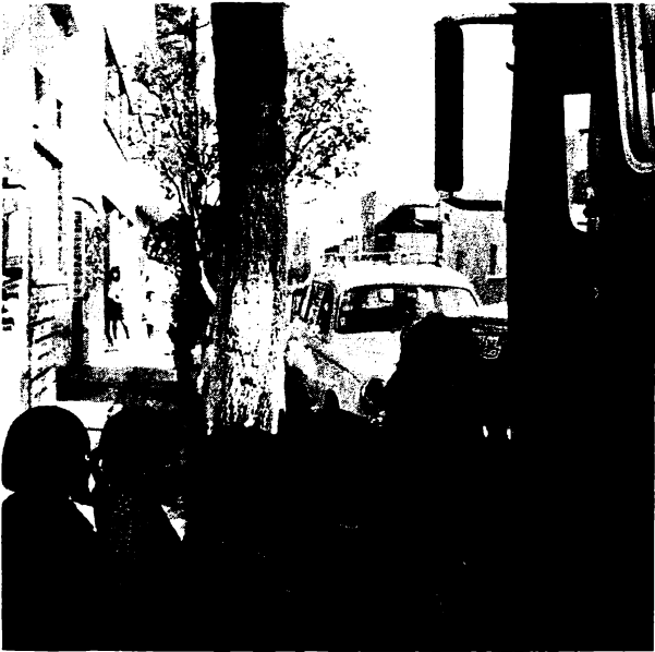
Los niños subiendo al transporte para ser conducidos al Museo.