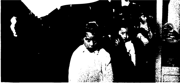
El momento en que los niños hacen una fila para subir al camión.