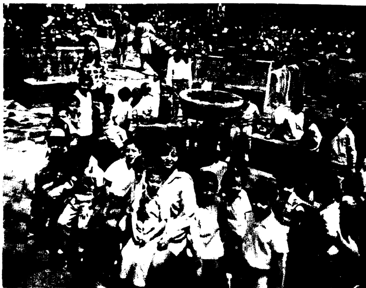
Los niños con las educadoras en una de las fuentes en los Jardines del Museo de Churubusco.