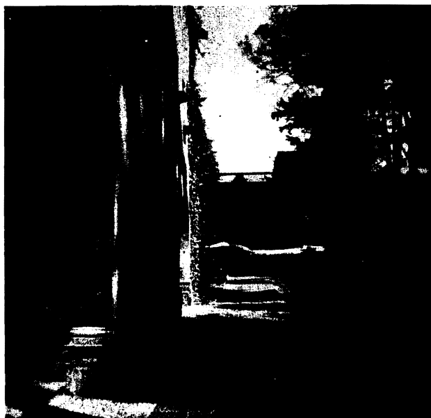
Una visita del Museo de Churubusco.