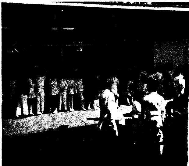
El grupo en espera de abordar el camión para hacer la visita al Museo de Churubusco.