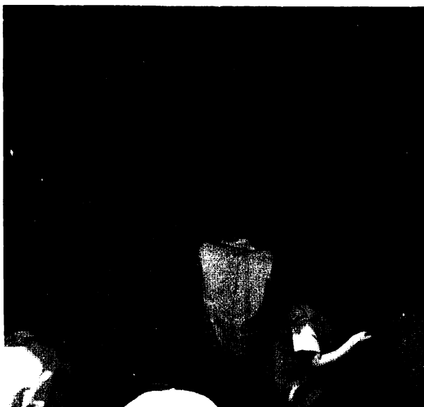
Aquí está el friso terminado sobre el tema "La Primavera"