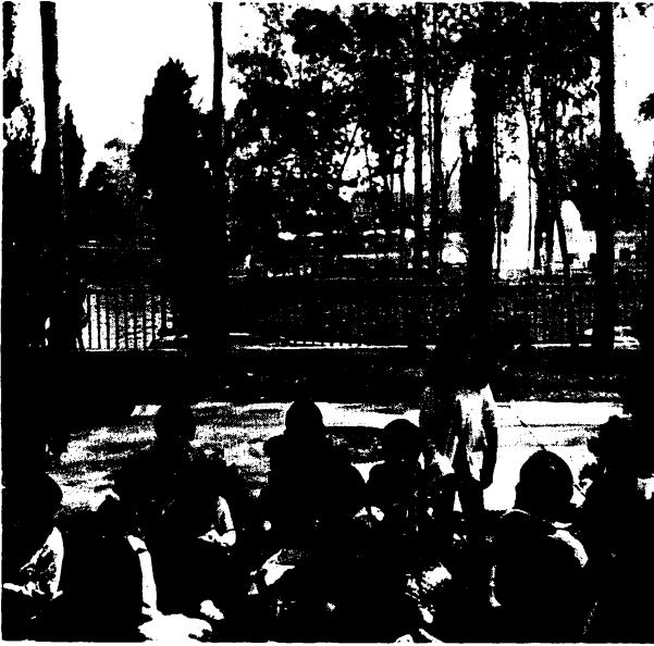
Los niños tomando un refrigerio.