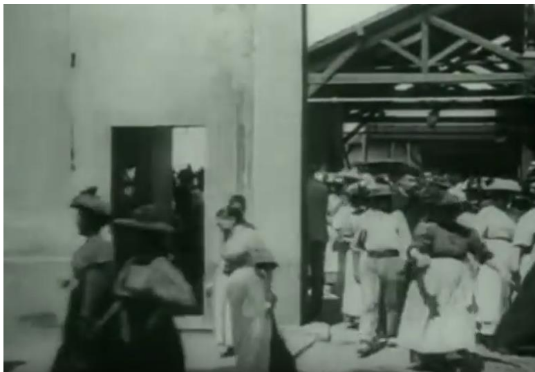
La salida de la fábrica 1895, [fotografía]. (2011). Recuperado de: https://www.youtube.com/watch?v=qPC5Nx8y5Yk

De esta manera, se proyectaron las primeras películas en 1895, gracias a los hermanos Lumière; sus grabaciones eran de un minuto y consistían en escenas de la vida cotidiana. Una de ellas fue: La salida de la fábrica en 1895, trata de la salida de los trabajadores de una fábrica, donde se aprecia a un grupo de personas caminando en las instalaciones.