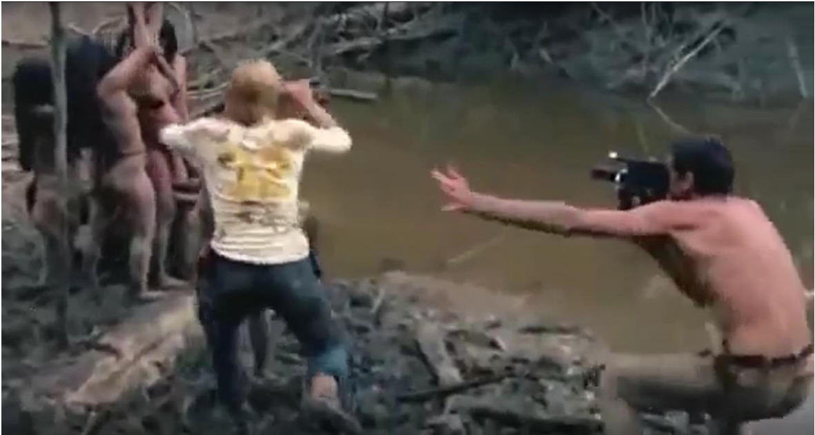
Imagen tomada de Holocausto Canibal (1980). [Fotografía]. (2017). Recuperado de: https://youtu.be/yBRbsYu9kso

En estos segmentos se utilizan las grabaciones de las dos cámaras, pudiendo contextualizar la acción realizada por las mujeres de la tribu, así como las posiciones de los periodistas, teniendo un panorama más amplio.