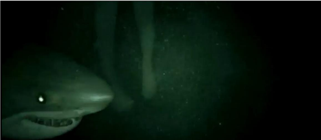
Imagen tomada de Terror en lo profundo (2017). [Fotografía]. (2017).

1:00:54/1:05:18 Megan entra en desesperación y comienza a gritar; los dos jóvenes tratan de controlarla, pero les es imposible; todos comienzan a discutir y sacan al tema la infidelidad por parte de Megan y Josh. Por tal razón, Jeff enfurecido se aleja; la mayoría de tomas son inestables, se sigue empleando el modo nocturno. Megan percibe un aleteo en su pierna y comienza a gritar; los jóvenes nadan hacia ella y graban la aleta del tiburón sobre su pierna. Posteriormente, se aprecia como Megan es sumergida por el animal y un revoloteo de agua, perdiendola de vista.