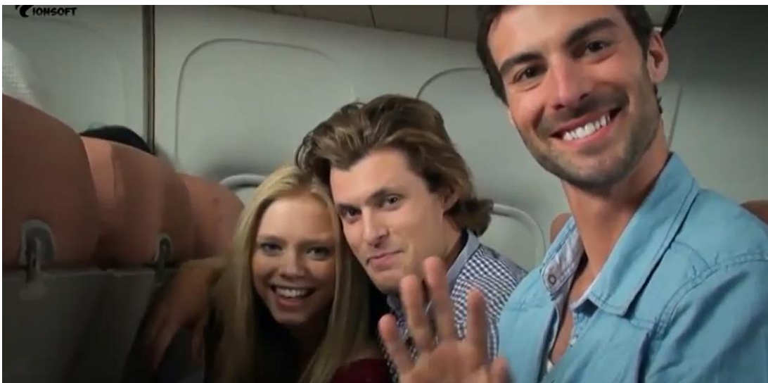
Imagen tomada de Terror en lo profundo (2017). [Fotografía]. (2017). Recuperado de: https://www.youtube.com/watch?v=0x0RTHxjggM&t=378s

1:11:15/1:12:11 Cortinillas y segmento de entrevista al primo Greg; presenta música extradiegética y metraje encontrado, iniciando el viaje.