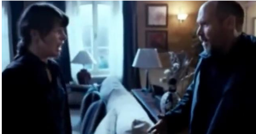
Cuarto Contacto (2009). [Ilustración]. Recuperado de: https://www.youtube.com/watch?v=37jnhg1RL3s