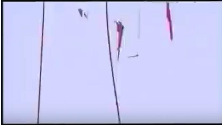
Fotograma Holocausto Canibal , Corte de cinta. Imagen tomada de Holocausto Canibal (1980). [Fotografía]. (2017).

Otro de los puntos importantes que ayudan al realismo de las cintas encontradas, es el que se aprecia el final de los metrajes, es decir, manchas que afectaron la cinta o efectos de maltrato; esto da credibilidad de que el material es totalmente verídico y se presenta tal como se encontró.