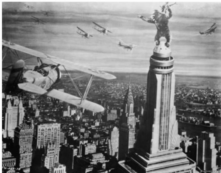
King kong en lo alto del Empire State, enfrentandose ante las avionetas King Kong 1933 [fotografía]. (2011). Recuperado de http://classiccinemaimages.com/king-kong-1933/king-kong-1933/