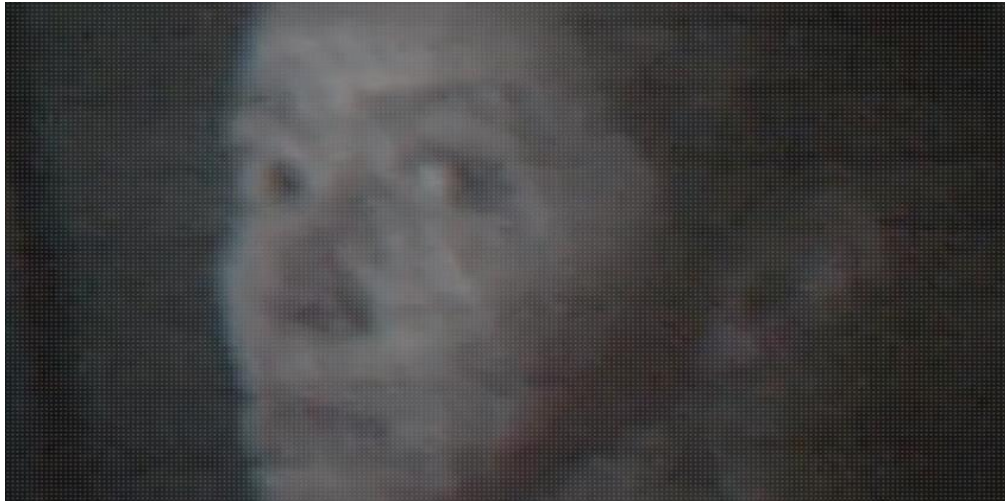
The Devil Inside , 2012. [Fotografía]. (2012).

En la presentación se pueden generar dos tipos de introducción del monstruo (vampiro, fantasma, entre otros), una, que los espectadores observen en las primeras escenas quién realizó los crímenes, y los personajes ficticios no lo sepan, “...este conocimiento tiene la función de generar una buena cantidad de suspense” (Carroll Noël, 1990, p. 213). Por otro lado, ni los espectadores ni los personajes ficticios tienen el conocimiento de quién está generando monstruosidades, por lo tanto, se sumergen a un ambiente totalmente desconocido y de misterio.