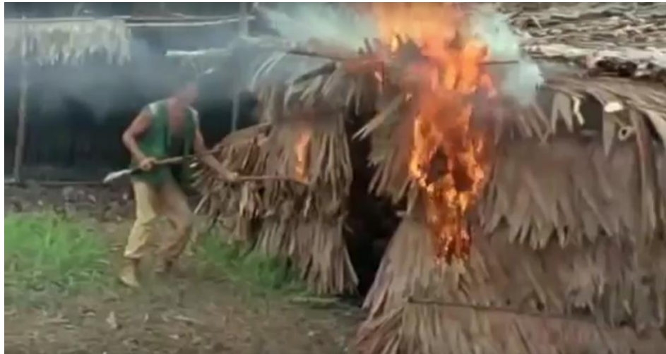
Imagen tomada de Holocausto Caníbal (1980). [Fotografía]. (2017). Recuperado de: https://youtu.be/yBRbsYu9kso

Los periodistas comienzan a realizar actos malévolos, quemando la aldea con nativos adentro, simulando un ataque entre los nativos Yacumo y otra tribu, además del asesinato de un cerdo, la musicalización contrapuntea en este tipo de escenas, presentando una melodía pacífica frente a la violencia, cinismo y sexo, algo característico de Deodatto.