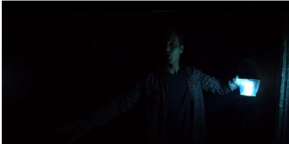
La noche del demonio 2010[fotografía]. (2011). Recuperado de: https://www.youtube.com/watch?v=eqYKw2-l1ow

Tercer Acto, toda la narración llega a su fin, teniendo al espectador al borde de la butaca del cine, preguntándose ¿logró o no logró su objetivo?