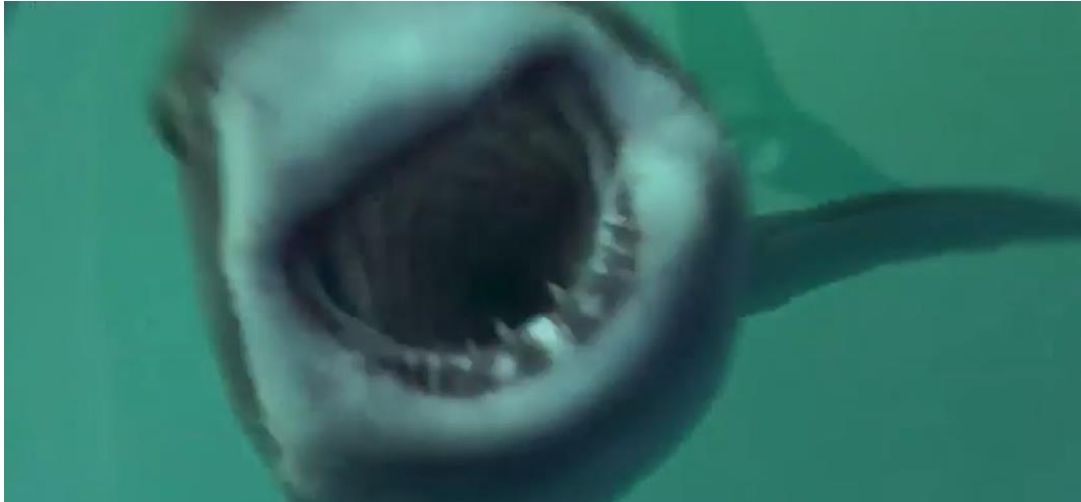
Imagen tomada de Terror en lo profundo (2017). [Fotografía]. (2017). Recuperado de: https://www.youtube.com/watch?v=0x0RTHxjggM&t=378s

1:08:20/1:11:00 Jeff ha fallecido, Josh lo detiene y lo suelta despidiéndose, posteriormente, el cuerpo se hunde y se pierde por completo; a continuación, Josh se autografa, dedicándole unas palabras a sus padres. Escucha un helicóptero, el sonido es diegético (las hélices, el oleaje y el tiburón), finalmente, la cámara graba el ataque del animal al último sobreviviente.