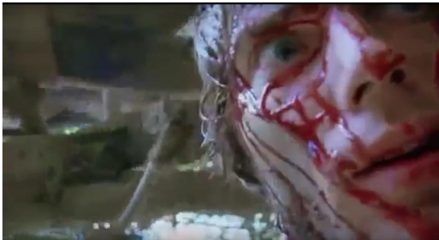
Imagen tomada de Holocausto Canibal (1980). [Fotografía]. (2017). Recuperado de: https://youtu.be/yBRbsYu9kso

Por último, capturan al camarógrafo, golpeándolo y tirándolo; esto hace que la cámara caiga al suelo y se observa la cara de Alan desangrándose.