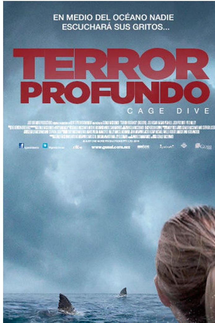
Imagen tomada de Terror en lo profundo (2017). [Fotografía]. (2017). Recuperado de: https://www.youtube.com/watch?v=0x0RTHxjggM&t=378s

La portada del filme Terror en lo profundo presenta un fotograma que no aparece en la película; esta imagen maneja tonos azules y blancos en su mayoría. Se puede observar cinco elementos que la conforman, teniendo a un personaje principal en cuadro y dos tiburones que habrán de generar los peores miedos de los protagonistas.