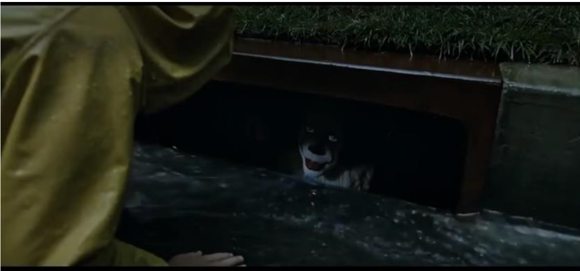
Escena del payaso en alcantarilla, It 2017[fotografía]. (2017).

Un gancho se puede visualizar fácilmente en la película de IT (2017) del, director Andy Muschietti, en los primeros minutos observamos a dos hermanos conversando, el mayor de los dos le regala al pequeño un barco de papel para que salga a jugar con él en la lluvia. Georgie (el pequeño) pone su barco de papel en un riachuelo pero, accidentalmente, se lo lleva la corriente a una alcantarilla; desilusionado por haber perdido el barco se asoma sobre el agujero y descubre a un payaso escondido, quien tiene su barco y se lo quiere regresar, mientras lo convence para que lo tome. Georgie introduce su mano dentro de la alcantarilla y el payaso lo muerde, jalándolo; esta escena da apertura para desarrollar la historia, denotando la extraña desaparición del infante en aquel pueblo.