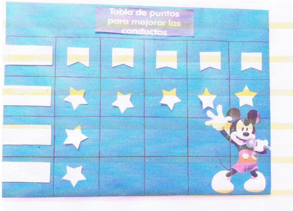
1.3 Tabla de economías de fichas