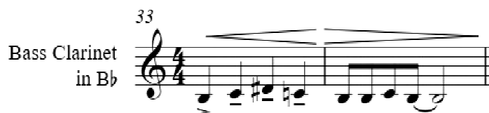
Fig. 49 compás 33.

Ambos ostinatos sufren transformaciones rítmico-melódicas (Fig. 50).