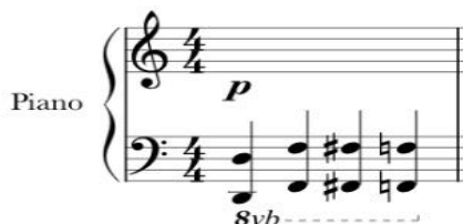
Fig. 28 compás 10

Este ostinato interactúa con elementos derivados de la variación rítmico-melódica y fragmentaciones del primer ostinato. Ejemplo: Compases 11 al 15 en el piano (Fig. 29).