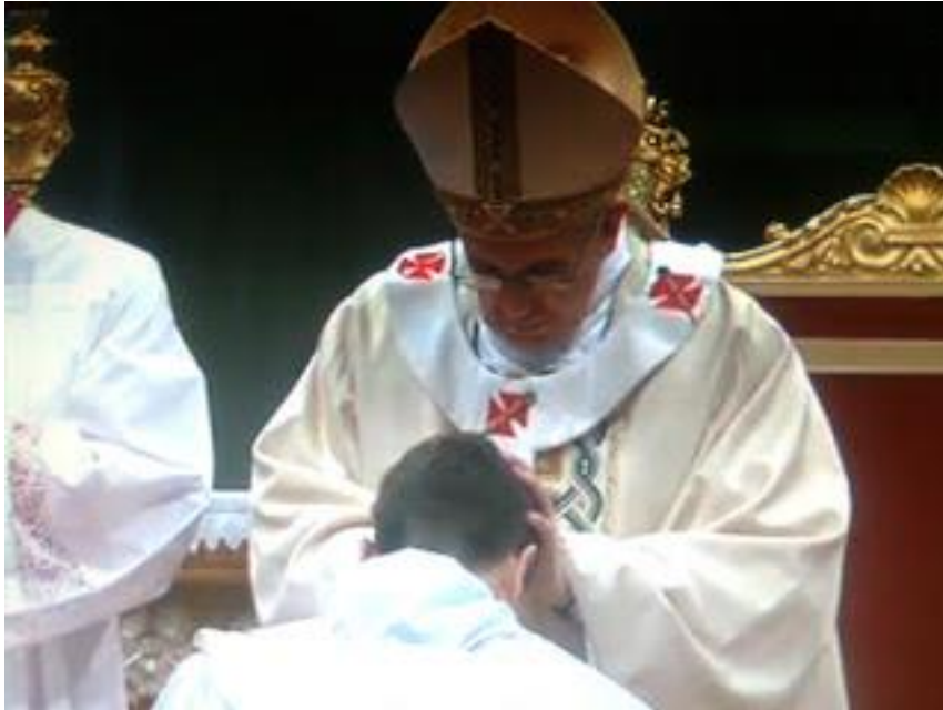
Obispo imponiendo las manos al candidato.

En la tercera parte el Obispo impone las manos sobre el candidato. Es el momento que el Espíritu Santo desciende por medio de esta acción sacramental al ordenado. Termina con la oración consagratoria y ya es sacerdote para siempre: “Te pedimos , Padre Todopoderoso, que confieras a estos siervos tuyos la dignidad del presbiterado; renueva en sus corazones el espíritu de santidad; reciban de ti el segundo grado del Ministerio Sacerdotal y sean, con su conducta, ejemplo de vida”.