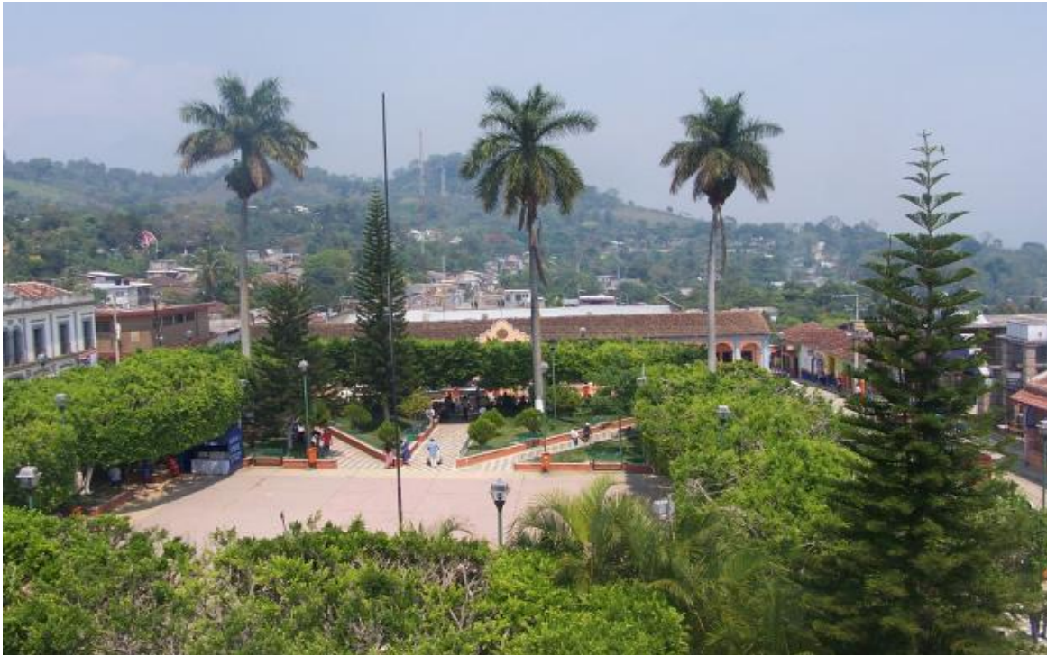
Parque Central de Simojovel

Simojovel, Chiapas es la cuna que vio nacer al niño que albergaría en su interior la vocación sacerdotal oculta hasta su tierna madurez. Albatros tuvo una infancia como la de muchos otros, guiada por esas maneras apropiadas de la vida de moldear las sensibles e inocentes personalidades de cada uno de nosotros, y lo conoceremos a continuación por su testimonio.