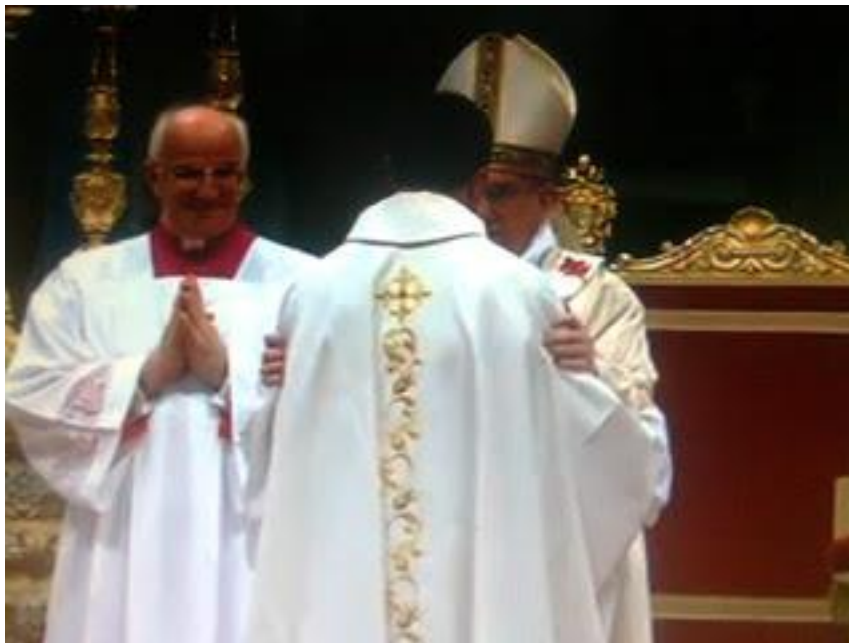
Obispo felicita al nuevo sacerdote.

Como se puede apreciar, al término de la ceremonia, el candidato ha dejado de serlo para, una vez investido y vestido, convertirse en sacerdote para siempre.