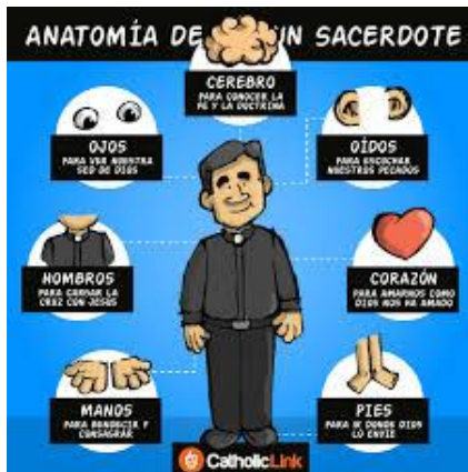
Anatomía de un sacerdote. De Catholic Link 53