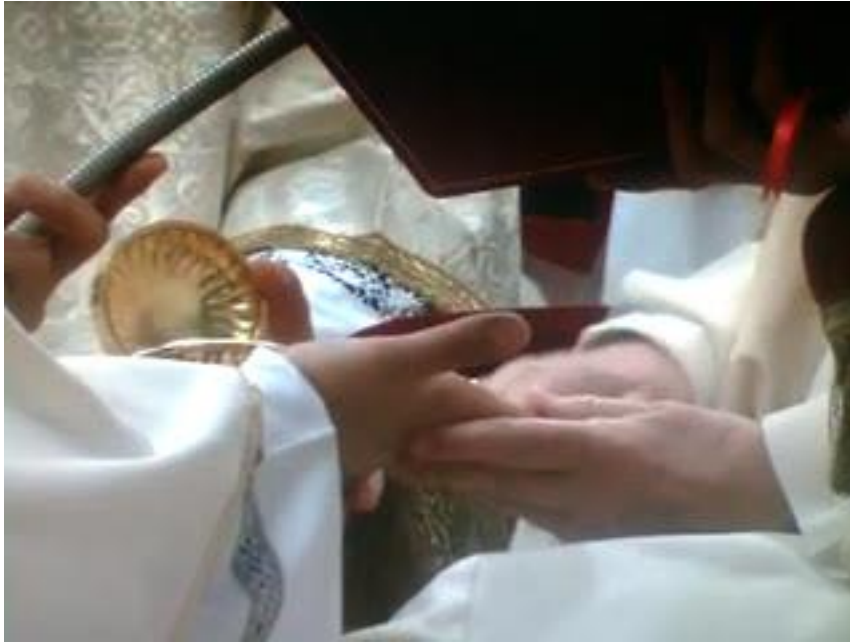
Unción de las manos.

En la quinta parte el Obispo entrega al nuevo sacerdote el cáliz y la patena, mientras le dice la siguiente oración: “Recibe la ofrenda del pueblo santo para presentarla a Dios. Considera lo que realizas e imita lo que conmemoras y conforma tu vida con el ministerio de la Cruz.”