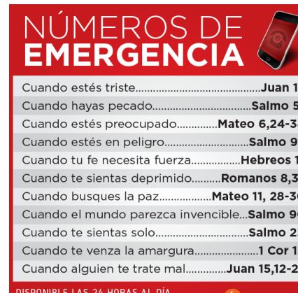
¿Cómo elegir un Santo Patrono? De Catholic Link 54

En palabras del P. Sotelo, esta situación es debida a que “Por desgracia las buenas noticias no son rentables. Estamos en un mundo altamente comercializado. Eso por un lado. Ahora bien, existen otros factores como la credibilidad. La credibilidad de la Iglesia es un factor determinante en la configuración de los procesos sociales. Esto sin duda no es bien visto por muchos órganos contrarios al actuar de la Iglesia, por lo que evitar, neutralizar y minimizar la credibilidad de la Iglesia, es una tarea de estos grupos.” 55