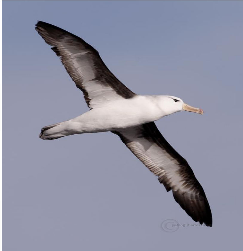
El albatros ojeroso en Galicia , autor Pablo Gutiérrez Varga (2015) 9

Juan Cantavella coincide con estos autores puntualizando que la semblanza “ Es una forma de entrevista más abocada hacia la biografía, pero que se basa en los datos y opiniones que aporta el propio biografiado. A ello se añaden los testimonios ajenos y el material que se haya obtenido de las fuentes disponibles, hasta formar una especie de mosaico, en el que unas piezas encajan dentro de otras en hábil ensamblaje. ” 10