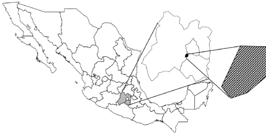
Fig. 1. Localización del PNLZ. Fuente: Diagnostico Ecoturístico del Parque Nacional Lagunas de Zempoala (Carrillo García, 2006).

El Parque Nacional “Lagunas de Zempoala” se ubica en los municipios de Huitzilac, Cuernavaca y Ocuilán en los Estados de Morelos y México respectivamente, está situado a 65 km al sur de la Ciudad de México y a 38 km al norte de la ciudad de Cuernavaca (Ver Fig. 1).