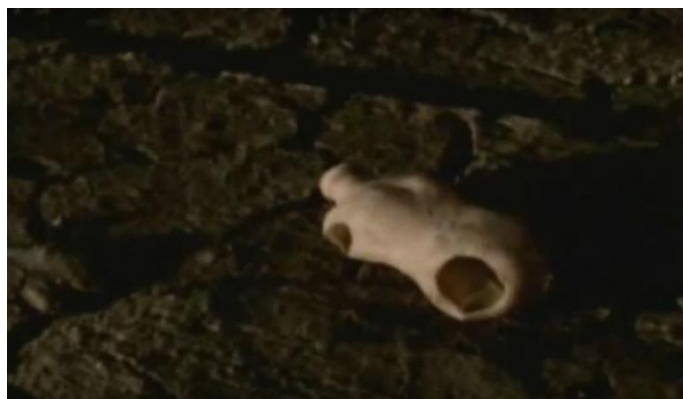
Imágenes del video Basurero . 215