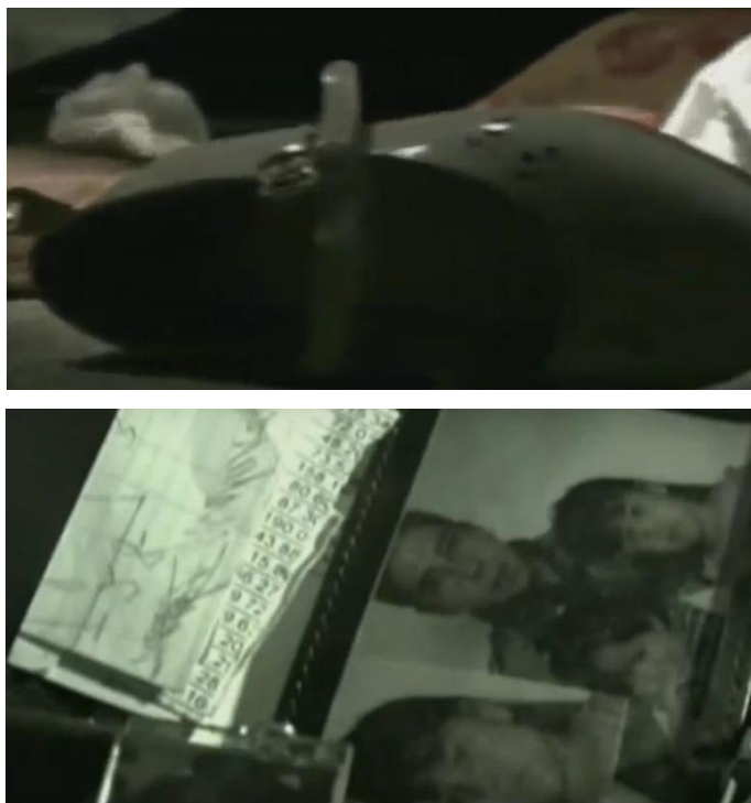
Imágenes del video Hotel . 217

Por otra parte, en el video titulado Hotel , se muestra ropa de un hombre adulto y de un infante tirada en el piso de una habitación de hotel, con sonidos y movimientos alusivos a relaciones sexuales como fondo, por lo cual se entiende que se trata de un caso de prostitución infantil. 216 El propósito del video se ve plasmado en una escena en la que se muestra la cartera del hombre, en la que porta una foto familiar con sus dos hijas en brazos, con la finalidad de mostrar que el infante por el cual está pagando sexo, posiblemente tendría la edad de sus hijas.