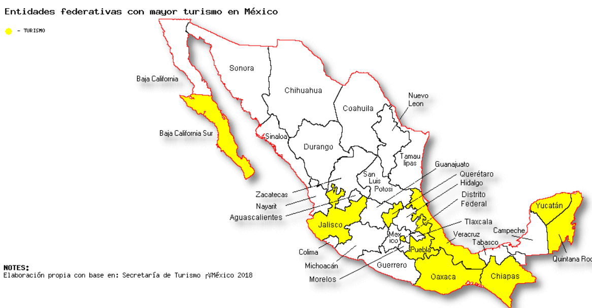
Mapa 4. Entidades federativas con mayor turismo en México

De acuerdo con documentos de la Secretaría de Turismo de México, 77 existe una gran cantidad de trata con fines sexuales en los principales puntos turísticos del país. Por lo tanto, una aproximación al fenómeno se puede tener mediante la ubicación de las entidades federativas con mayor turismo, como se muestra en el siguiente mapa.