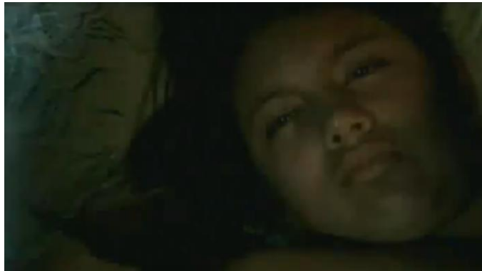
Imágenes del video 15 años . 213

En esta misma línea se encuentra el video Basurero , en el que se expone a través de imágenes tomadas en tiraderos de basura, partes de cuerpos de muñecas rotos y maltratados que fueron echados a la basura, como simbolismo de que al comprar sexo se reafirma la idea de que las personas y sus cuerpos tienen fecha de caducidad, volviéndose utilizables y desechables. 214