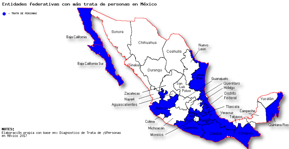
Mapa 3. Entidades federativas con más trata de personas en México

Elaboración propia con base en Diagnóstico de Trata de Personas en México de la UNODC. 61