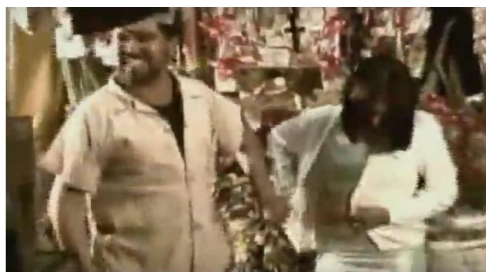
Imágenes del video Virgencita . 210