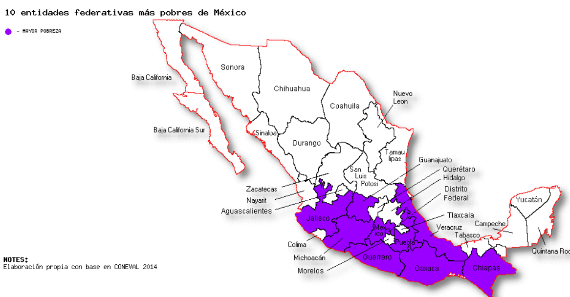
Mapa 2. Las 10 entidades federativas más pobres de México

Es importante analizar la conexión que existe entre los niveles de inseguridad con la dinámica de desigualdad económica que impera en el país. En este sentido, se expone el siguiente mapa en el que aparecen las diez entidades federativas con mayores indicadores de pobreza, según datos del Informe de pobreza en México del Consejo Nacional de Evaluación de la Política de Desarrollo Social -CONEVAL- 2014. 56