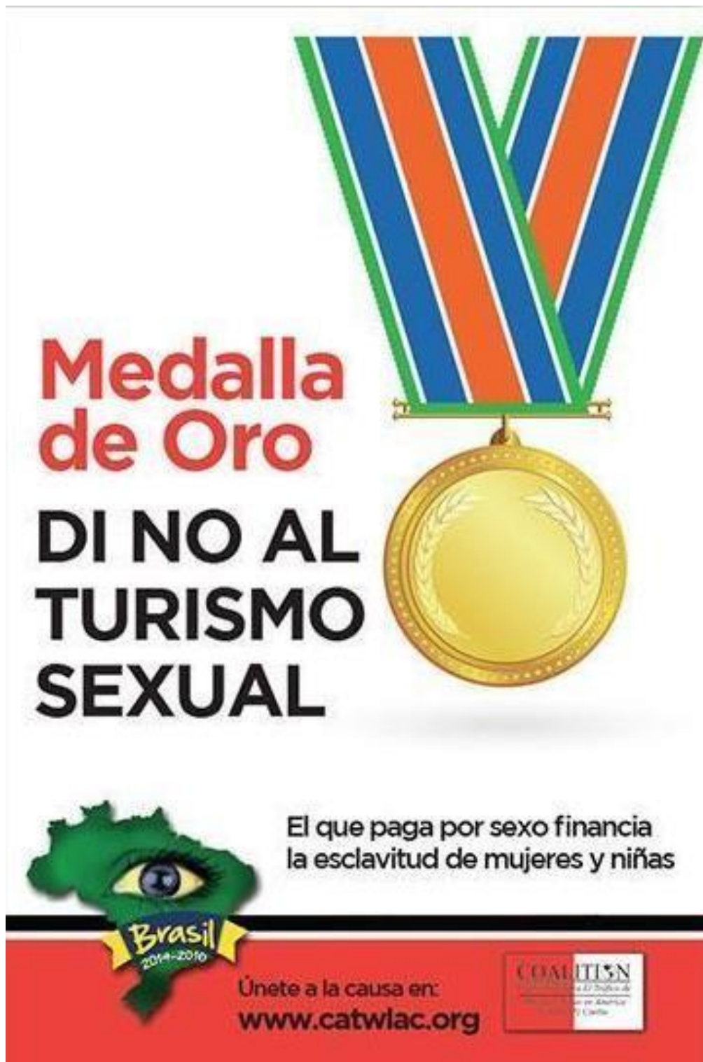
Infografía obtenida de la página oficial de CATWLAC. 232