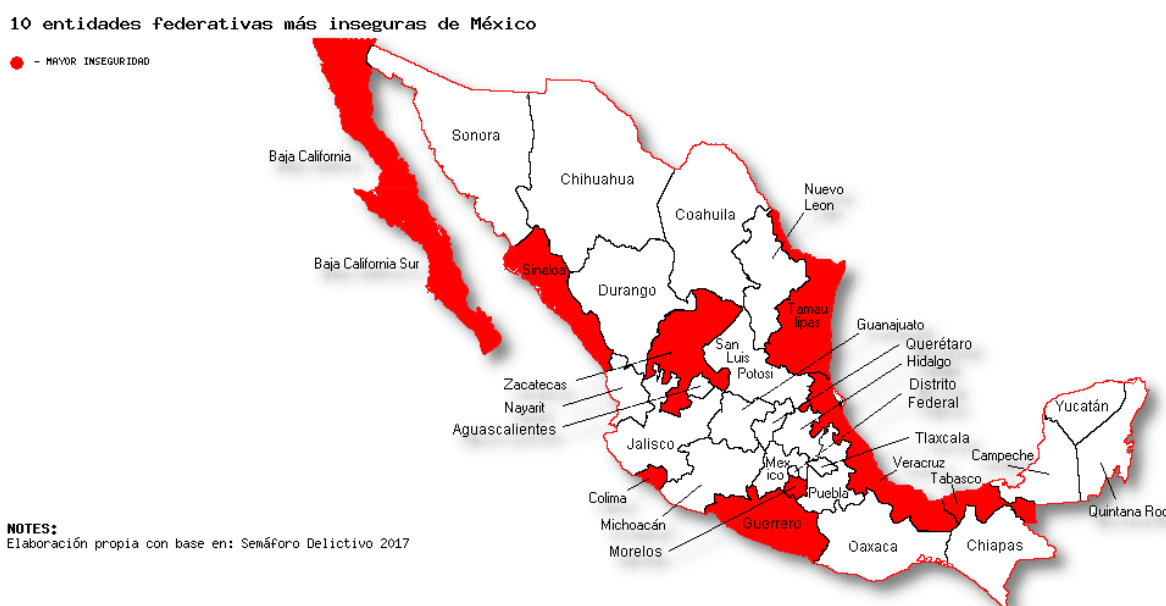
Mapa 1. Las 10 entidades federativas más inseguras en México

En este sentido, dando paso al factor geográfico, cabe mencionar que las diez entidades federativas con mayores índices de inseguridad identificadas por el Semáforo Delictivo 2017, están representadas en el siguiente mapa.