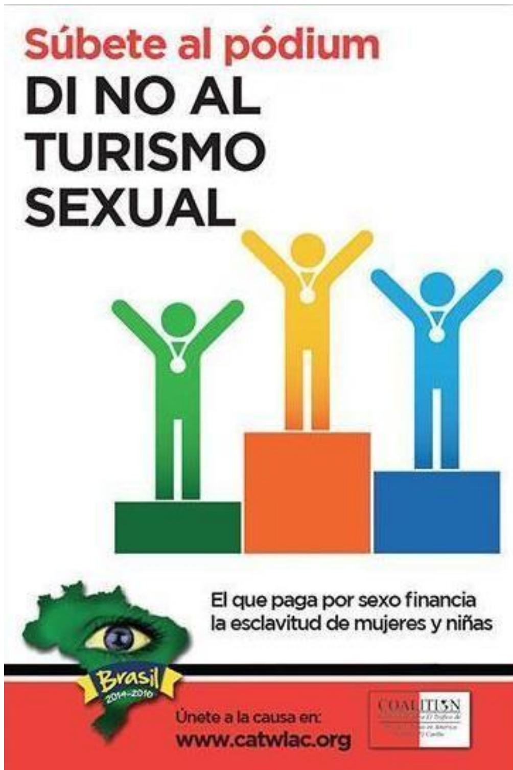
Infografía 4. Súbete al pódium. Di no al turismo sexual

Infografía obtenida de la página oficial de CATWLAC. 233