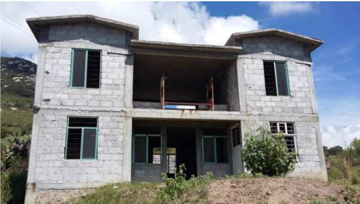
Vivienda en proceso constructivo, Santuario Mapethé.