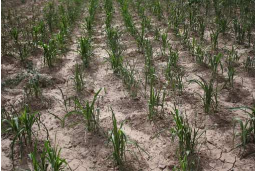
Maíz escardado y con aporque, Comunidad El Decá, Cardonal

vierten en su tierra abono de origen orgánico, en algunos casos avícola y, generalmente, ovino-caprino y de rastrojos descompuestos. Algunos campesinos mezclan el abono en sus tierras en el barbecho y no lo vuelven a hacer durante la escarda, mientras que otros lo hacen en ambos periodos.