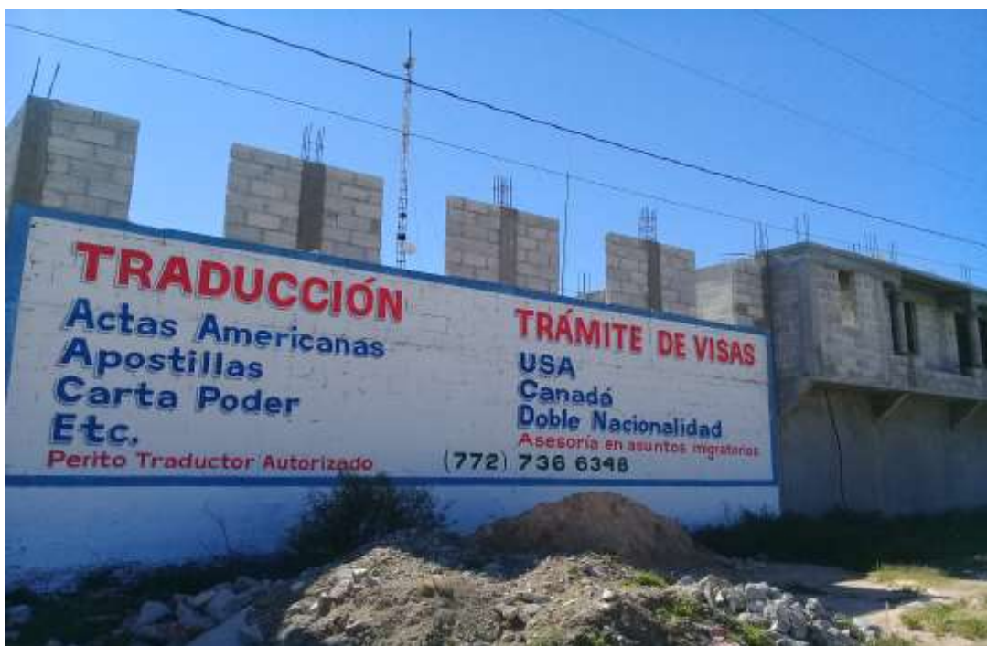
Anuncio facilitadores de la migración sobre casa en construcción en Cardonal

matrimonio y residencia. En este punto, el impulso de las mujeres por abreviar la etapa de residencia patrilocal, así como el de imaginar mayores niveles de autonomía respecto del control masculino, continúa viendo en la migración una posibilidad. Ello transforma al proyecto migratorio en una opción siempre latente también para las mujeres, especialmente para aquellas que no poseen el capital cultural suficiente para proyectar otras vías de abrazar esas aspiraciones 153 .