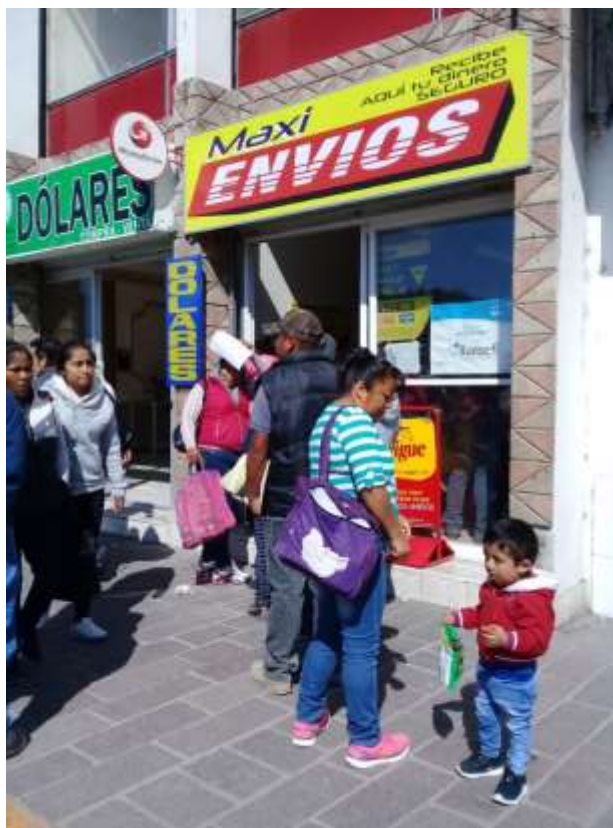
Centros de recepción de remesas en día lunes de plaza en Ixmiquilpan

La espera administra el tiempo de la incertidumbre respecto de las discrepancias temporales de la migración. En este sentido, la espera no es la duración suspendida sino la movilización permanente, renovada en el instante mismo en que el ausente tenga que ejercer presencia. Acá el tiempo cronológico no es el más relevante, porque, parafraseando a Bachelard (2002:33), tal vez se pueda medir la espera, pero no la atención misma que recibe su valor de intensidad en un solo instante. Ese instante, constantemente renovado, es el que otorga presencia a los ausentes.