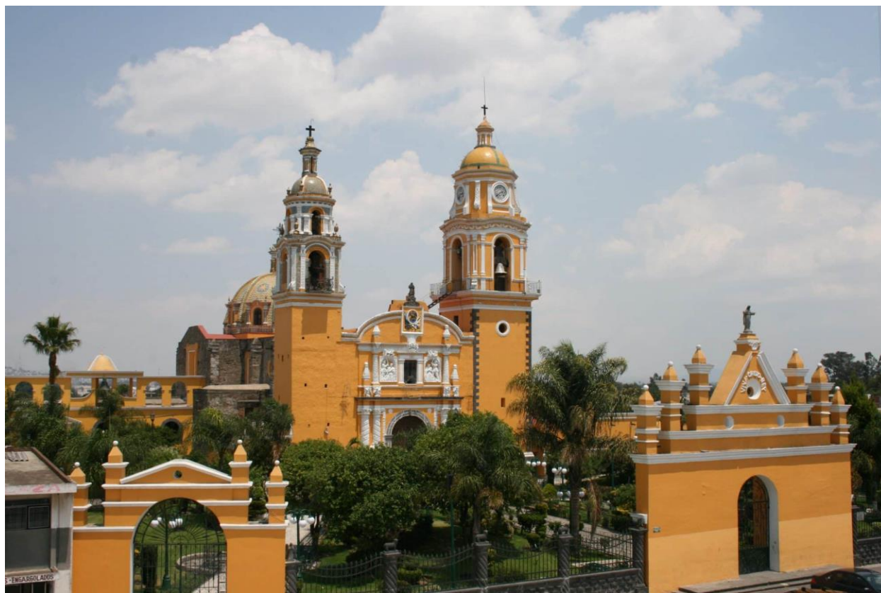
Figura 3: Imagen que muestra el edificio de la iglesia de Cuautlancingo, como se puede observar actualmente.