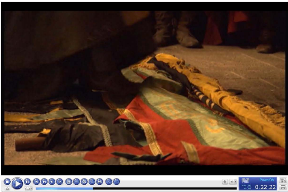
Capturas de pantalla propias tomadas de la serie