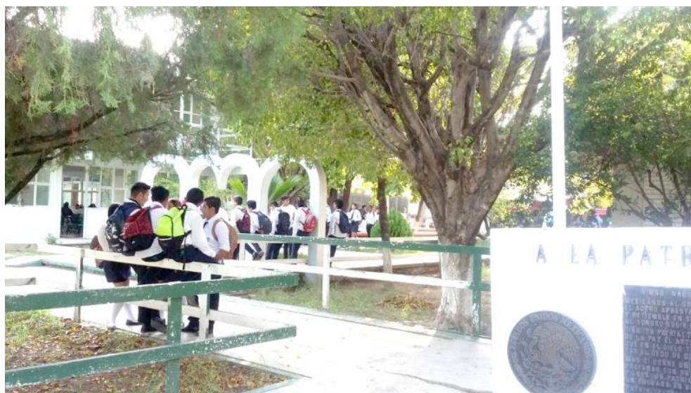
Anexo 3. Alumnos en receso