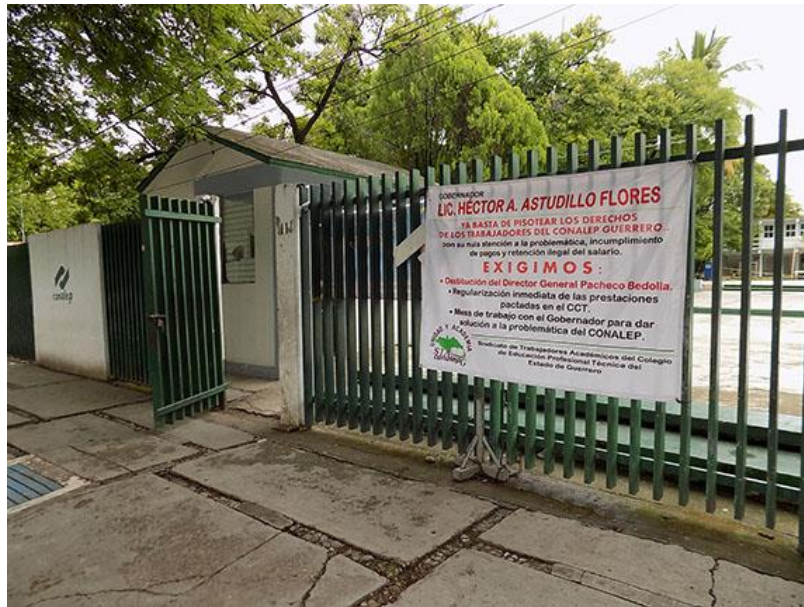
Anexo 1. Fachada del CONALEP 112