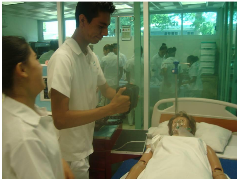
Anexo 2. Alumnos de Enfermería en práctica