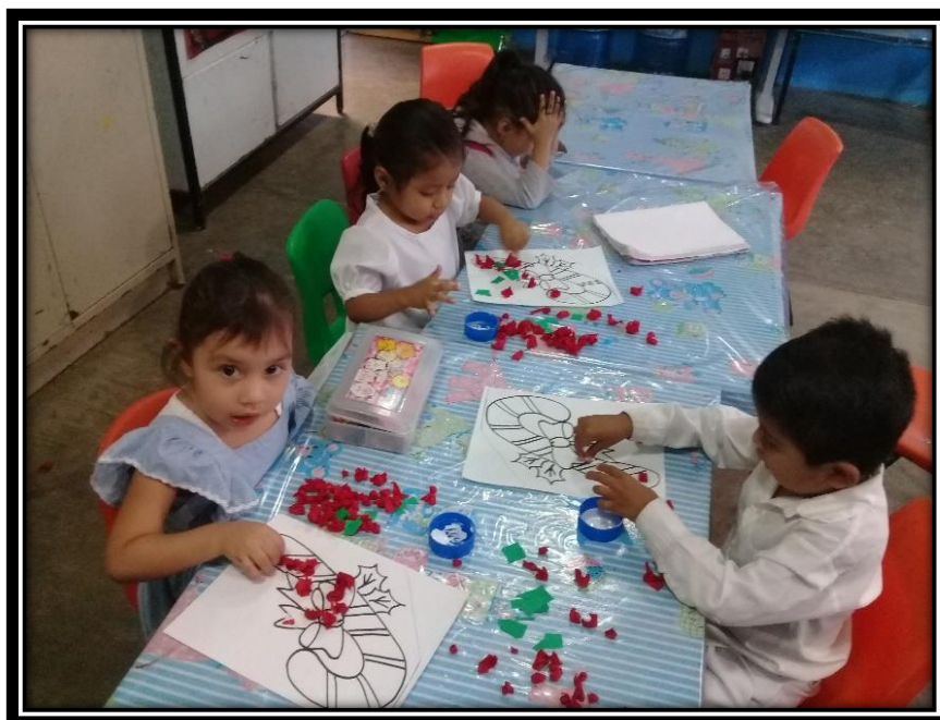
Niños de primer grado realizando una actividad para favorecer la motricidad fina, realizada en uno de los días que no asistió la maestra.