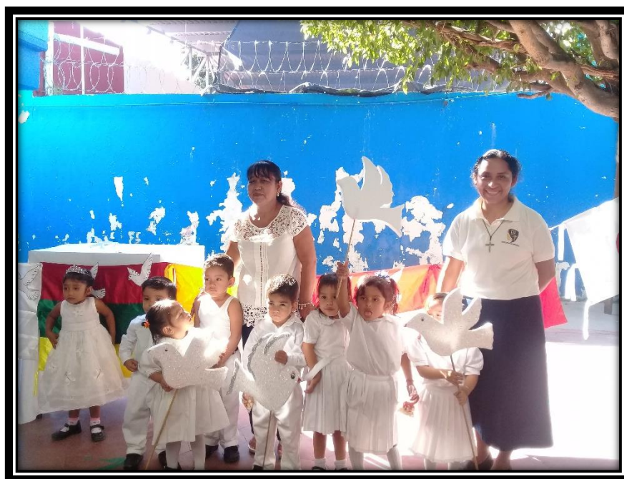
Alumnos del grupo muestra, festejando el día de la ONU