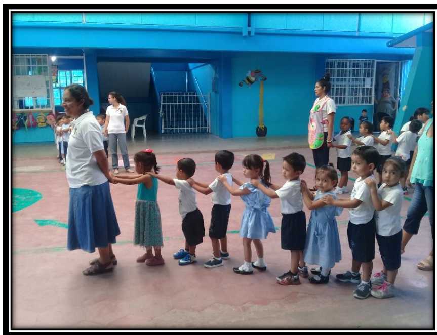
Activación física antes de iniciar las clases