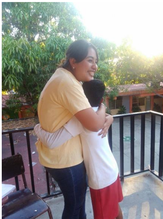
Anexo 6. Actividad de regalar abrazos realizada con el grupo de 2° "K"