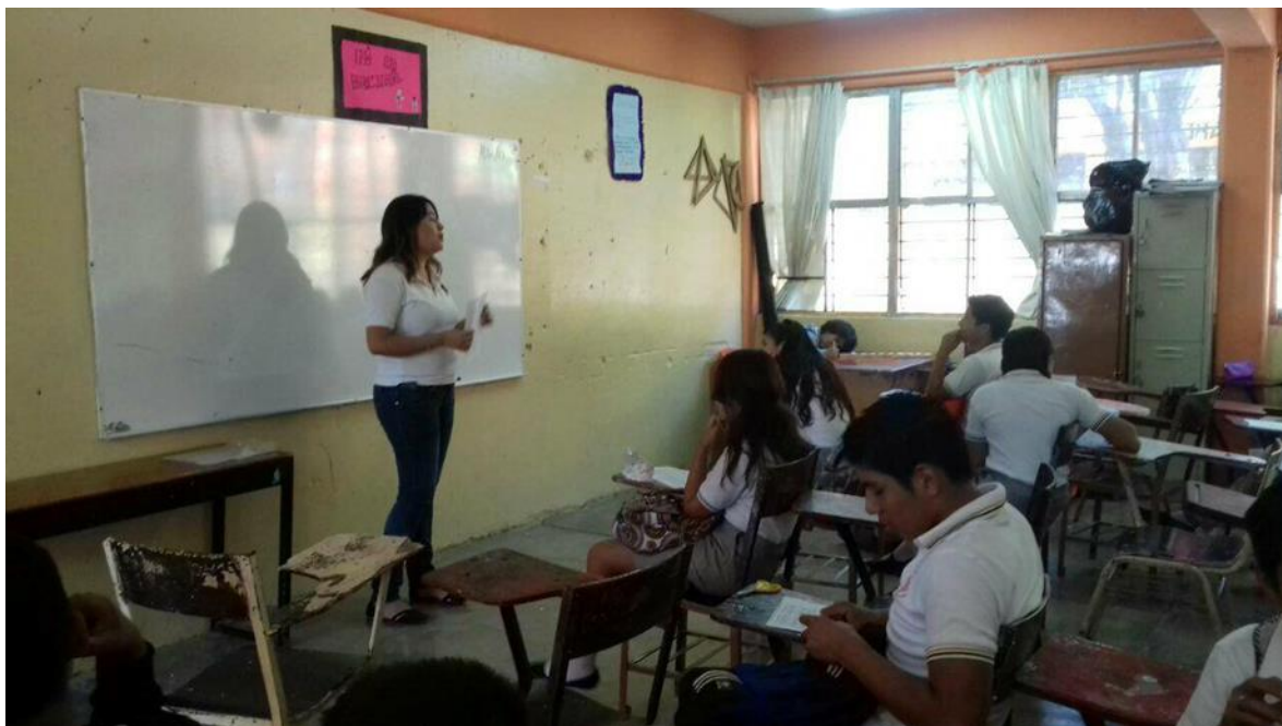
Anexo 5. Actividad sobre control de emociones realizada en la clase de tutoría con el grupo 2° "H"