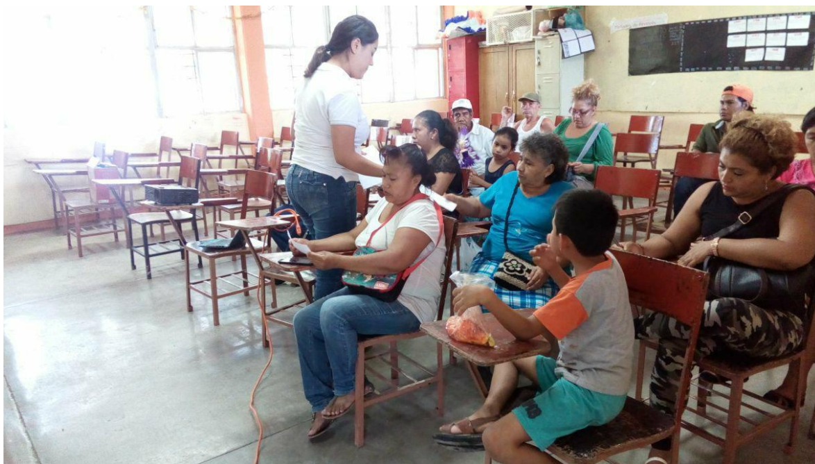
Anexo 4. Aplicación de encuestas a los padres de familia de los segundos años